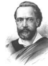
Karel Hynek Mácha

Pod staletým dozorem pyšného Radobýlu, na břehu řeky Labe, obklopeno zvlněným Středohořím, leží město Litoměřice, jehož historie sahá do daleké minulosti. Na náměstí, z nějž se dá historická sláva královského města zřetelně číst z gotických, renesančních a barokních staveb, stojí i krásná secesní budova – litoměřická knihovna Karla Hynka Máchy.