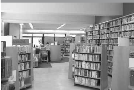
Oddělení pro dospělé ve Šrámkově ulici

V roce 1961 byl jejím působištěm Kulturní dům Petra Bezruče, jenž svými prostory slouží kultuře dodnes. Ve stejném roce se podařilo knihovnu rozšířit i připojením místních lidových knihoven Dolní Suchá, Životice, Šumbark a Dolní Bludovice. V Kulturním domě Petra Bezruče působila knihovna až do roku 1970. Zde fungovala jak oddělení pro dospělé, tak pro dospívající mládež. O něco později byla zřízena knihovna v prostorách nynější havířovské radnice, kde již pracovalo sedm zaměstnanců. V roce 1959 tu bylo založeno i oddělení katalogizace. V této době evidovala okolo 3500 čtenářů a to ještě nikdo netušil, jak moc se tento počet navýší.