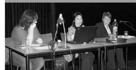
Prezentace Obecní knihovny v Petřůvkách