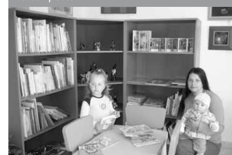
Oddělení pro děti

Druhou neméně důležitou náplní mé práce je metodická pomoc knihovnám obvodu. V roce 1975, kdy jsem nastoupila do tehdy Střediskové knihovny v Bystrém hned po maturitě na knihovnické škole, jsem měla v obvodu deset knihoven. Za ta dlouhá léta došlo k různým změnám v těchto knihovnách. Setkala jsem se s vynikajícími knihovníky, i těmi, kteří brali funkci dobrovolného knihovníka jako povinnost a ne radost. Činnost knihovny se odvíjí od konkrétní práce knihovníka, vztahu obce – starosty, zastupitelstva ke knihovně. Některé knihovny se nacházejí ve stejně nevýhodných místnostech jako před lety, jiné mají důstojné prostory, kam je radost chodit nejen pro knížky.