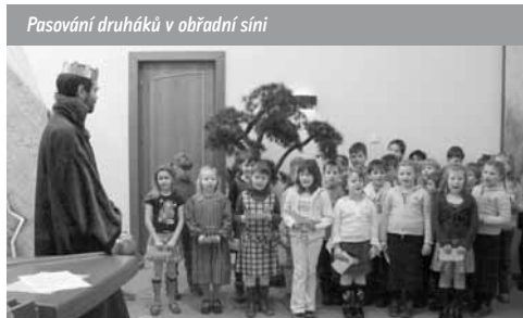
Pasování druháků v obřadní síni