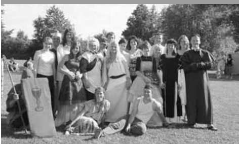
Skupina Čtyřlístek z dětského dne – Cesta do minulosti

Ale nejdůležitější je samozřejmě naše práce s lidmi. Knihovna již není jen místem výpůjček knih, je místem kulturního dění, komunitní centrum a i my jsme se chtěli aktivně do takové práce zapojit. Začali jsme vyhlašování literárních a výtvarných soutěží a postupně jsme si přidávali náročnější akce. V současné době pořádáme pravidelně Noc s Andersenem (letos byla již šestá) a starším čtenářkám, které stále chtějí tyto Noci navštěvovat, připravujeme Noc s princeznami. Pasovali jsme již čtyři třídy „druháků“ na rytíře řádu čtenářského a moc se nám osvědčilo pasovat právě druháky, kteří hned začínají číst a spousta těchto malých čtenářů rozšíří trvale počet návštěvníků knihovny. Pro děti pořádáme i pěveckou soutěž, se kterou bychom se už ale do knihovny