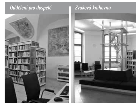
Oddělení pro dospělé

Městská knihovna Jihlava působí v krajském městě s téměř 50 000 obyvateli. V uplynulých letech se postupně transformovala do podoby moderní informační a vzdělávací instituce, která nabízí svým uživatelům bohaté knihovní fondy, pestré spektrum služeb a vhodné podmínky pro organizaci různých komunitních aktivit.