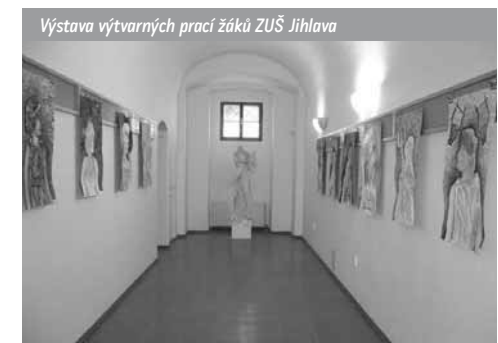
Výstava výtvarných prací žáků ZUŠ Jihlava

Knihovna je pověřena výkonem regionálních funkcí na území okresu Jihlava a soubor těchto služeb pravidelně využívá 98 neprofesionálních knihoven. Od roku 2002, kdy mohla být tato činnost po nucené osmileté přestávce díky státní dotaci obnovena, je v celém regionu patrný jednoznačně pozitivní vývoj. Došlo k řadě změn v umístění a vybavení knihoven, v rozvoji jejich činnosti a nabídce služeb, kvalitě knihovních fondů a v komunikaci prostřednictvím moderních informačních technologií.