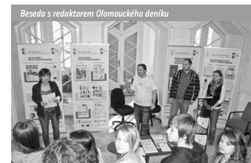
Beseda s redaktorem Olomouckého deníku

□ Pokud je tvorba časopisu na školách uskutečňována skutečně jako projekt, může se stát výborným nástrojem pro realizaci všech pilířů mediální výchovy a potažmo i rozvoje čtenářské gramotnosti. Pomáhá tříbit novinářský styl, rozpoznat prvky manipulace, nacházet hranice mezi virtuálním a reálným světem. Dává dostatečný prostor pro sebereflexi, pro zamýšlení se nad záměrem textu, pro rozvíjení dovednosti nalézt podstatné a pravdivé informace a pro schopnost s nimi dále účinně pracovat... U tvorby sborníku je to podobné. Od touhy psát je totiž jen krůček k otázce „jak na to?“. A to už jsme u hlubšího přemýšlení o textech a pozornějšího čtení, což jsou dva konkrétní cíle výuky čtenářské gramotnosti z mnoha. Nicméně podpora tvorby školních časopisů a sborníků není jediným bodem našeho projektu. Máme mnoho dalších aktivit, kterými směřujeme k rozvoji čtenářské gramotnosti.