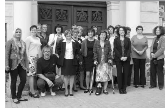
Realizační tým oslav

tří pater schodiště čekalo drobné občerstvení. Provázávali všichni knihovníci a knihovnice.