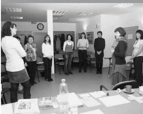
Semináře probíhají interaktivní formou

Úsek knihovnictví MZK získává zpětnou vazbu informace, že programy z předchozích kurzů tohoto typu jsou v praxi využívány a školy je hodnotí velmi pozitivně. Druhý dvoudenní kurz pro pracovníky služeb se konal v prosinci loňského roku opět za finanční podpory SKIP ČR, ve spolupráci s Knihovnou Jiřího Mahena – Centrem dětského čtenářství. Kurz pod názvem Výchova k občanství v praxi českých škol – realita a vývoj. Možnosti pro práci s dětmi a mládeží ve veřejných knihovnách byl koncipován jako dílna, vedená metodou zkušenostního učení lektory z Centra pro demokratické učení při GEMINI o. s. Praha a Centra občanského vzdělávání při Masarykově univerzitě Brno. Opět se jednalo o střídání ukázkových lekcí k jednotlivým tématům a cílům, s teoretickými vstupy a formulováním klíčových dovedností aktivního občana (tedy žáků základních a středních škol).