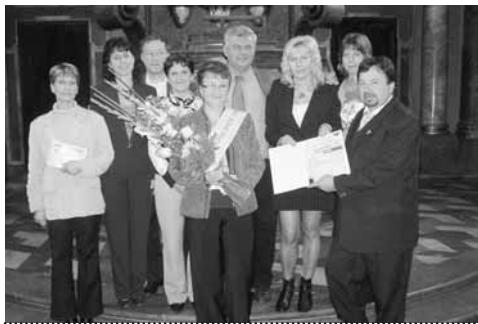
Předávání ceny Knihovna roku knihovně v Pavlovicích u Přerova