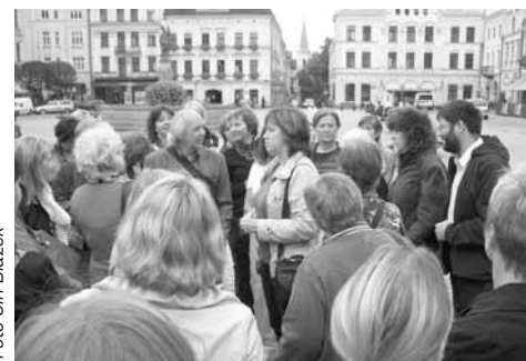
Účastníci odborné exkurze do historických knihoven v Těšíně (Polsko)