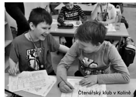
Čtenářský klub v Kolíně

Mluvit o jídle a mluvit o knihách v běžném životě velké rozdíly nevykazuje. Chceme se podělit o silný zážitek a při první příležitosti, kdy nám je ochoten někdo naslouchat, to uděláme. Jednosměrná komunikace moc možná není a jedince, kteří si povídají pro sebe, nikdo vážně nebere. Ovšem zveřejňování zápisků je dnes snazší než dřív. Deník je privátní. Publikování textů o přečtených knihách vyžaduje nejen osobní zaujetí, ale