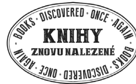
Logo projektu Knihy znovu nalezené

V dnešní době je důležitou součástí propagace její vizuální stránka. Proto jsme již na prvním setkání s norským partnerem diskutovali o vizuální značce projektu. Postupem času jsme přišli s návrhem loga v designu razítka. Při