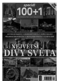
Obr.2: Vlastní obálka tohoto souborného záznamu

Rok: 2015 ISBN: 9770322962003 NKP-CNB: cnb000357052