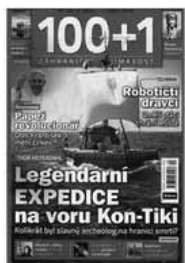
Obr.1: Nejaktuálnější obálka tohoto souborného záznamu detail