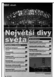
Obr.4: Vlastní obsah tohoto souborného záznamu

Příklad zobrazení na stránkách projektu — periodikum: 100+1 – http://www.obalkyknih.cz/view?isbn=0322-9629 — vicesvazkové dílo: Ottův slovník naučný nové doby – http://obalkyknih.cz/view?nbn=cnb000602512