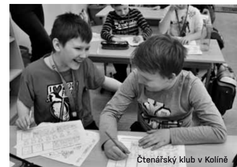
Čtenářský klub v Kolíně

Mluvit o jídle a mluvit o knihách v běžném životě velké rozdíly nevykazuje. Chceme se podělit o silný zážitek a při první příležitosti, kdy nám je ochoten někdo naslouchat, to uděláme. Jednosměrná komunikace moc možná není a jedince, kteří si povídají pro sebe, nikdo vážně nebere. Ovšem zveřejňování zápisků je dnes snazší než dřív. Deník je privátní. Publikování textů o přečtených knihách vyžaduje nejen osobní zaujetí, ale