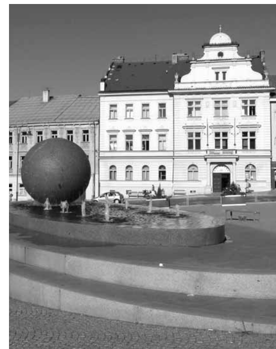
Knihovna Jana Drdy v Příbrami

V literatuře si připomeňme například proudy označované jako symbolismus a dekadence. Významný rok to byl zpětně i proto, že se narodili budoucí básníci Jiří Wolker (29. 3. 1900 – 3. 1. 1924), Vítězslav Nezval (26. 5. 1900 –