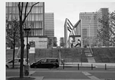
Francouzská národní knihovna

V červenci 1989 pak mezinárodní porota doporučila F. Mitterrandovi čtyři projekty, z nichž francouzský prezident vybral čtyřhvězovou budovu. Autorem je mladý francouzský architekt Dominique Perrault, a F. Mitterrand ji inauguroval 30. března 1995. V prosinci následujícího roku otevřel Mitterrandův nástupce Jacques Chirac veřejnosti studijní knihovnu a v říjnu 1998 byla zpřístupněna i knihovna vědecká.