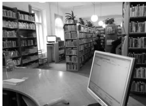
a do oddělení pro dospělé

Teď, promiňte, poposkočím z historie do současnosti. Nejvíce oddělení pro čtenáře je stále (od roku 1984) ve stejné budově, která již dnešnímu typu služeb nevyhovuje. Ale co je nejhorší, nemáme prostor pro knihy. Kolik knih na-