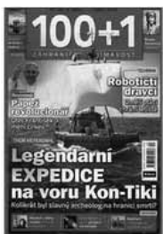
Obr.1: Nejaktuálnější obálka tohoto souborného záznamu detail