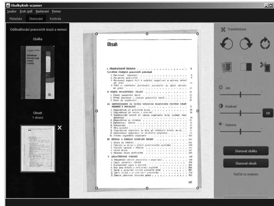
Ukázka ze skenovacího klienta projektu

Velký dosah pro čtenáře bude mít poslední novinka projektu. V případě titulů, u kterých bylo provedeno naskenování obsahu, poskytují Obalkyknih.cz knihovním systémům obsah převedený pomocí OCR do textu. V JVK se full-