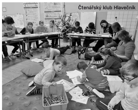
Čtenářský klub Hlavečnick

Zapsat si, co jsme četli a jak se nám to líbilo, je pro čtenáře činnost naprosto pochopitelná. Sama si z dětství pamatuji, jak mě k pečlivým záznamům o knihách motivovalo každoroční prázdninové putování po slovenských horách, při kterém jsme si s dětmi ze spřátelených rodin vyprávěli, co jsme za uplynulý rok zajímavého přečetli. Internet však zamíchal kartami. Nemusíme čekat dvanáct měsíců, než se sejdeme o dovolené, díky sociálním sítím jsme s podobně naladěnými lidmi v kontaktu bez ohledu na vzdálenosti. Mnoho skupin třeba na Facebooku sdružuje čtenáře, ať