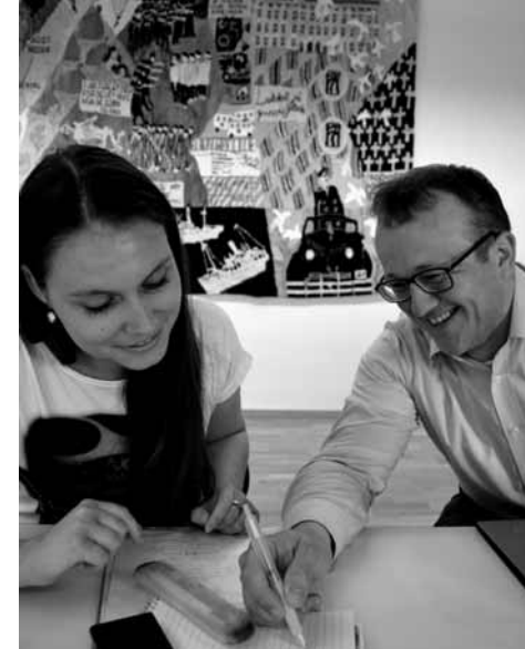
Pracovníci NK ČR na workshopu v Stiftelsen Arkivet