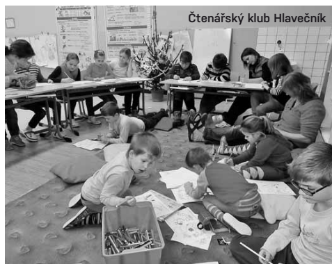
Čtenářský klub Hlavečnick

Zapsat si, co jsme četli a jak se nám to líbilo, je pro čtenáře činnost naprosto pochopitelná. Sama si z dětství pamatuji, jak mě k pečlivým záznamům o knihách motivovalo každoroční prázdninové putování po slovenských horách, při kterém jsme si s dětmi ze spřátelených rodin vyprávěli, co jsme za uplynulý rok zajímavého přečetli. Internet však zamíchal kartami. Nemusíme čekat dvanáct měsíců, než se sejdeme o dovolené, díky sociálním sítím jsme s podobně naladěnými lidmi v kontaktu bez ohledu na vzdálenost. Mnoho skupin třeba na Facebooku sdružuje čtenáře, ať