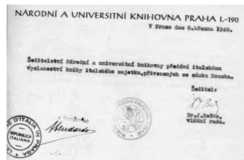
Předávací protokol

Prvotní premisou výzkumu bylo, že většina knih nacházející se v současnosti v depozitáři pocházela ze severočeských zámků – Nového Berštejna, Nového Falkenburgu, Housky a Mimoně, kam se dostaly prostřednictvím nacistických organizací (ERR, RSHA), které tyto knihy konfiskovaly prakticky v celé Evropě a v důsledku postupující války je evakovaly právě na zámky v Sudetech. Studium archivních dokumentů uložených v Národním archivu České republiky (fond Ministerstvo školství, Ministerstvo kultury, Zemský národní výbor v Praze),