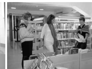
Studijní cesta pracovníků InBáze, z. s., a Městské knihovny v Praze na Island