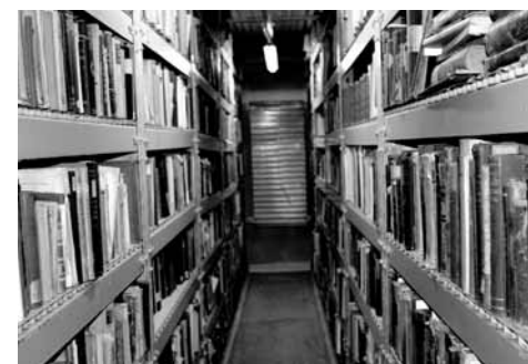
Sklad NK ČR v Neratovicích

Mezi stěžejní cíle patří řádné zpracování a zaevidování 12 000 svazků knih z depozitáře NK ČR v Neratovicích. Zhruba polovina z nich souvisí s knihovnami zahraničních lóží svobodných zednářů. Knihy z depozitáře vybíráme na základě provenienčních znaků (razítka institucí a exlibris bývalých majitelů).