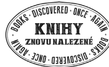
Logo projektu Knihy znovu nalezené

V dnešní době je důležitou součástí propagace její vizuální stránka. Proto jsme již na prvním setkání s norským partnerem diskutovali o vizuální značce projektu. Postupem času jsme přišli s návrhem loga v designu razítka. Při