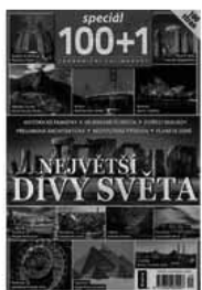
Obr.2: Vlastní obálka tohoto souborného záznamu

Rok: 2015 ISBN: 9770322962003 NKP-CNB: cnb000357052