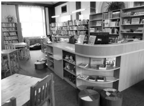
Pohled do dětského oddělení...

Vrátím se ale k historii naší příbramské knihovny. Víme, že knihovna byla pro veřejnost otevřena od 18. do 19. hodiny večerní, každé úterý a pátek. A zkusím si představit (a zkuste to se mnou), jak asi na čtenáře působil v těchto