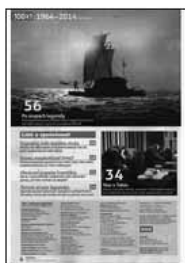
Obr.3: Nejaktuálnější obsah tohoto souborného záznamu detail