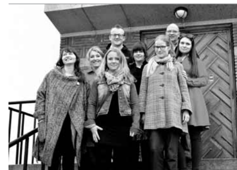
Pracovníci NK ČR spolu s norskými kolegy na workshopu v Stiftelsen Arkivet

Společně chceme odpovědět na otázku, jakým způsobem zavlčené či konfiskované knihy ilustrují nakládání s evropským kulturním dědictvím. Spolupracujeme především v oblasti prezentace výsledků – jedním z výstupů projektu je uspořádání virtuální a zároveň i fyzické výstavy, na nichž budeme rekonstruovat příběhy knih a zasazovat je do souvislostí s událostmi 2. světové války.