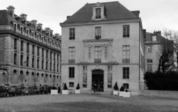
Bibliothèque de l'Arsenal je zaměřena zejména na francouzskou literaturu XVI. až XIX. století

Nová stavba, umístěná v třináctém pařížském okrese, umožnila změnit celkovou strukturu instituce. Od roku 1994 tedy existuje Francouzská národní knihovna (Bibliothèque nationale de France), sdružuje sedm míst, z nichž je nová budova budovou ústřední, do které byla umístěna většina tiskovin. V historickém soubudoví ze XVII. století okolo ulice Richelieu zůstávají manuskripty, fotografie a grafiky, partitury a mince. V Opeře Garnier je department věnovaný klasickému divadlu, opeře a baletu, Bibliothèque de l'Arsenal je zaměřena zejména na francouzskou literaturu XVI. až XIX. století, v Avignonu se nachází Maison Jean Vilar se současnou dramatickou tvorbou. Mimo Paříž, v Bussy Saint Georges a v Sablé sur Sarthe, jsou technická a konzervační oddělení.