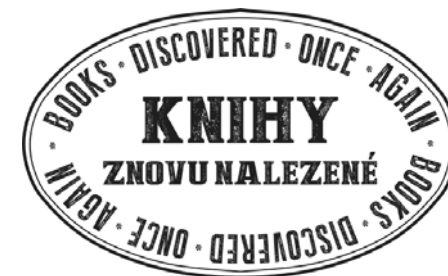
Logo projektu Knihy znovu nalezené

V dnešní době je důležitou součástí propagace její vizuální stránka. Proto jsme již na prvním setkání s norským partnerem diskutovali o vizuální značce projektu. Postupem času jsme přišli s návrhem loga v designu razítka. Při