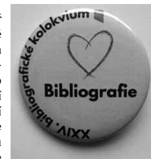
Odnášek z kolokvia