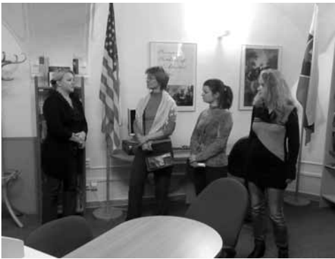
Česká kulturní delegace v ŠVK BB v roce 2011

výmenné pobyty ředitelů a vedoucích pracovníků, odborné stáže, výměna zkušeností a publikací. Osmého července 1999 byla spolupráce obnovena podepsáním prováděcí dohody, která je od této doby každoročně aktualizována (v roce 2016 bylo slovo dohoda nahrazeno slovem smlouva).