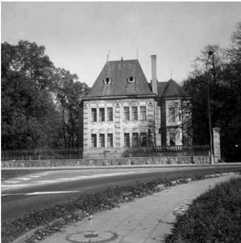
Sekerova vila – zde sídlila knihovna více než 30 let (1960–1992)

Knihovna získává nového ředitele Jana Svobodníka, který setrvá ve funkci dlouhých 32 let!