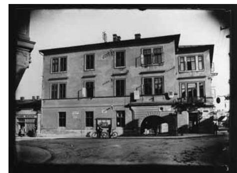
Budova okresní politické správy. Nejstarší sídlo knihovny v Místku (1923–1933)