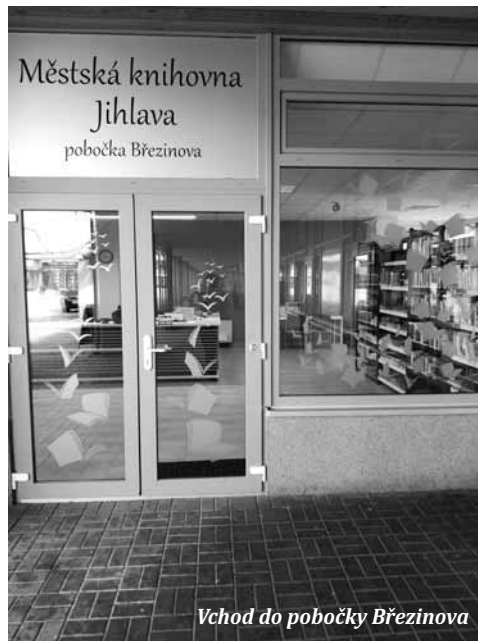
Vchod do pobočky Březinova

V roce 2018 se naskytl jedinečná příležitost přemístit pobočku na protilehlou stranu obchodního centra do uvolněných přízemních prostor, které spravuje jiný majitel. Rada města Jihlavy souhlasila se změnou a s navýšením nájmu a dokonce se našla mimořádná finanční dotace zřizovatele, která uhradila velkou část nákladů spojených s projektem, interiérovým vybavením, technickými pracemi a vlastním stěhováním, přičemž majitel objektu zajistil na vlastní náklady potřebné stavební úpravy a výmalbu.