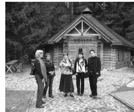
Česká kulturní delegace v ŠVK BB v roce 2009