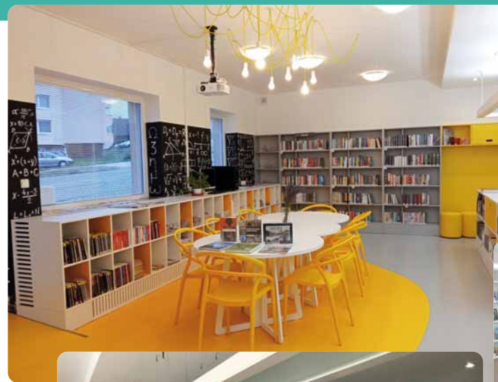
Pobočky Městské knihovny Jihlava v novém s. 74–76