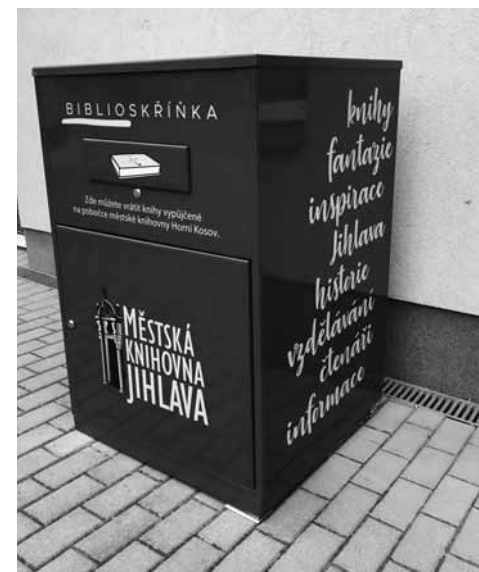
Bibliobox pobočky Horní Kosov

Městská část Horní Kosov je nejvzdálenější od centra města Jihlavy. Služby kulturního a vzdělávacího charakteru zde do otevření pobočky chyběly, a do knihovny si tak velmi rychle našli