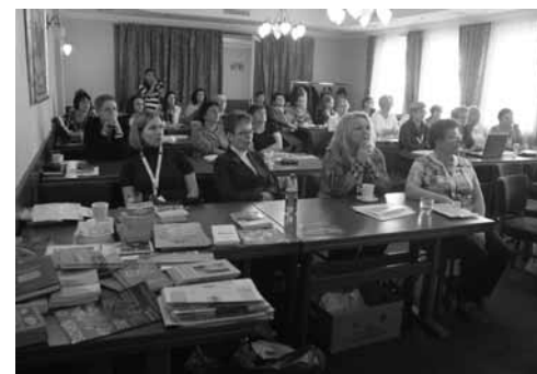
Pohled na účastníky 17. kolokvia v Pezinoku