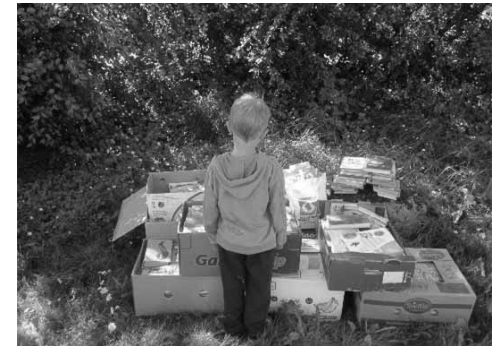
Výsledek sbírky českých knih pro děti a mládež

Již v létě 2012, krátce po založení spolku, proběhla v České republice první sbírka knih pro děti a mládež, které se staly základem české knihovny na Islandu. Knihovna se zrodila z potřeby poskytnout žákům v české škole dostatek materiálu ke čtení, aby mohli dál rozvíjet svou češtinu. Bez dětských knih by bylo těžké naučit děti bohatou, pestrou češtinu, a přestože si rodiče často knížky z Čech vozí, geografická vzdálenost, omezení hmotnosti zavazadel na palubách