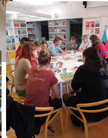
← Pohled do interiéru nových prostor

← Studovna a čítárna ↓ Jednání instruktorského klubu na pobočce