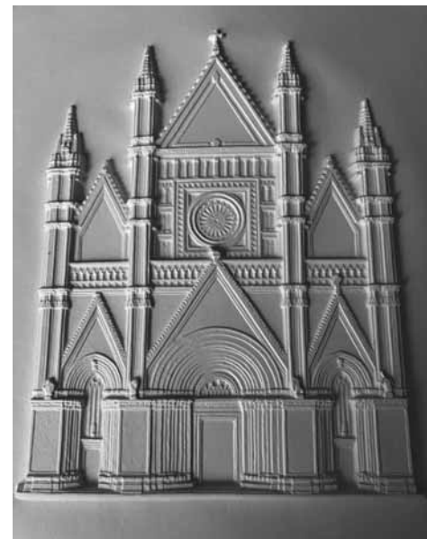
Ukázka reliéfní grafiky

Čtenáři jsou o novinkách v knihovně informováni na webu, v bulletinu Informace knihovny ,