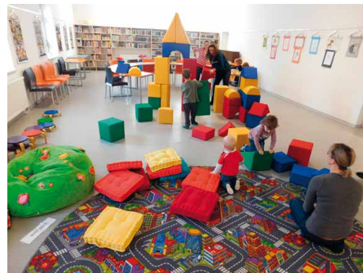
Neušlo nám s. 459

↑ Městská knihovna Litvínov si své 110. výročí založení připomínala s vtipem a nadhledem