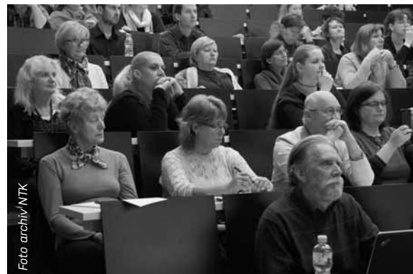
Pohled do auditoria konference EFI

Fungování CzechELib bude pilotně ověřeno prostřednictvím zajištění EIZ v letech 2018 až 2022, přičemž z projektu bude financován nákup přístupů v letech 2018–2020. Díky projektu dojde k výraznému zkvalitnění informační infrastruktury výzkumu podporovaného z veřejných prostředků a v důsledku toho i podmínek pro zvýšení produktivity výsledků VaVaI v ČR, jakož i k usnadnění reflexe a hodnocení těchto výzkumů jak na úrovni jednotlivých výzkumných organizací, tak i na národní úrovni. Připojení k CzechELib bude dobrovolné, bude na ně však vázána finanční podpora z veřejných zdrojů, kterou získají instituce, jež se zapojí do projektu před uzavřením smluv s vydavateli.