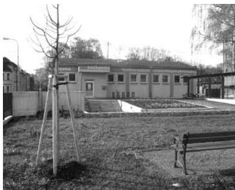
Vybydlená budova školky před rekonstrukcí... ...a po rekonstrukci přeměněná na knihovnu

periodik, knihovna ale zároveň funguje jako běžná pobočka KMO, a poskytuje tak své služby všem ostravským čtenářům.