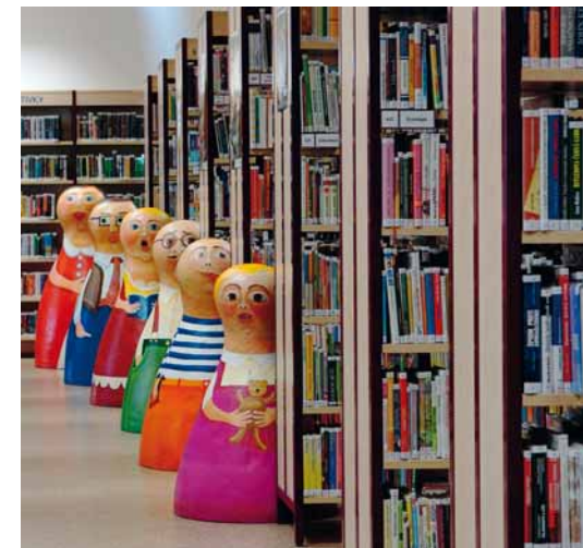
Neušlo nám s. 459

↑ Galerie a muzeum M. D. Rettigové v jejím rodišti ve Všeradicích bylo otevřeno v roce 2010