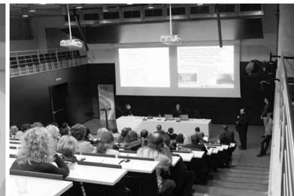
Momentka z průběhu konference

Předmětem projektu je systémová změna zajištění přístupu k informačním zdrojům z oblasti vědy, výzkumu a inovací (dále jen VaVaI) v souladu s Národní RIS3 strategií (zkratka z Research and Innovation Strategy for Smart Specialisation) s cílem zvýšit výkonnost VaVaI CzechELib. Projekt bude probíhat v letech 2017 až 2022, v letech 2018–2020 bude z projektu podpořen i nákup přístupů k elektronickým informačním zdrojům (EIZ), v letech 2021 a 2022 bude obnovena podpora ze státního rozpočtu. Po celou dobu projektu bude monitorována jeho efektivita. Projekt poskytne věrohodné statistiky využívání zdrojů a zvýšenou podporu pro hodnocení vědy.