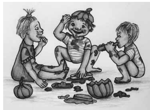
Illustrace Eva Kotlanová

maže obličej. Čili seznamujete se, randíte s kokosovým olejem daleko déle, než trvá sáhnout po něm poprvé do správné police v supermarketu. Máte takovou zkušenost? A to randění, ta fáze seznamování, je důležitá skoro u každého nákupu. U nákupu trávení volného času zrovna tak.