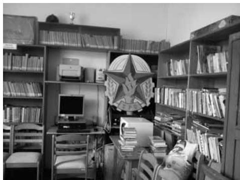
Pohled do interiéru knihovny ve Skřivani