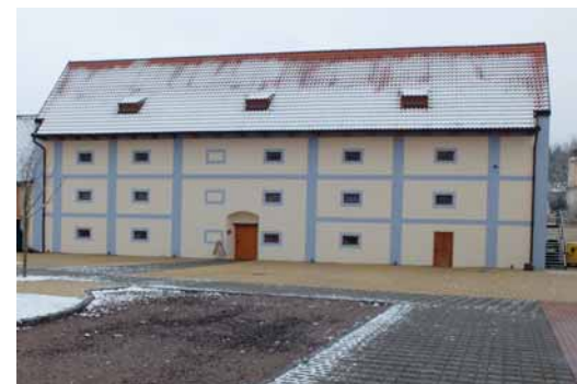
Literární paměť středních Čech s. 451

VAŠÍČEK, Arnošt. Nedobytná šifra: tajemství Vojnichova rukopisu: co skrývá nejzáhadnější kniha světa? Ostrava: Mystery Film, 2011. 124 stran: ilustrace (některé barevné), faksimile. ISBN 978-80-904190-5-6 Xaa 9.848/B