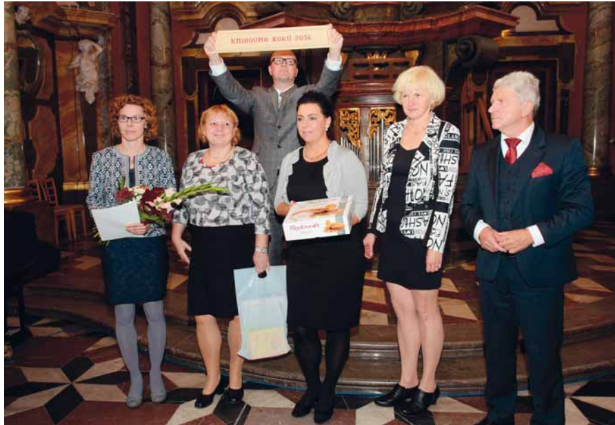
← Obecní knihovna v Rapotíně – Knihovna roku 2016 (kategorie: Základní knihovna)