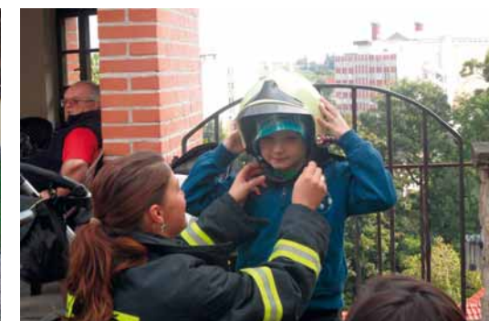
Recept z Chrudimi s. 453

↑ Z bohatého programu dětské knihovny v Chrudimi: ukázky práce s dravci a z návštěvy mladých hasičů