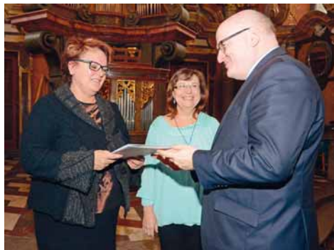
↑ Knihovna Kroměřížska, p. o. (kategorie: Informační počin)