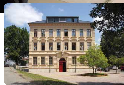
↑ Rekonstruovaná budova bývalé školy, dnes Knihovna Kutná Hora