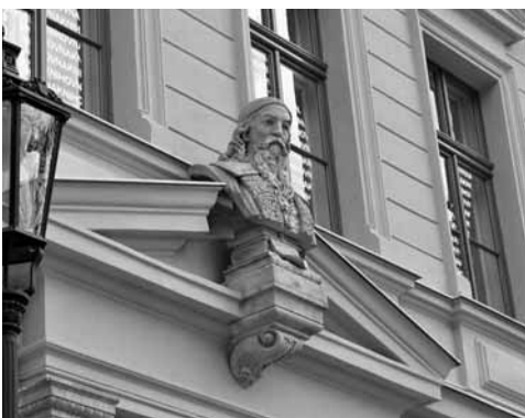
Zachované původní historické prvky výzdoby na fasádě budovy, bývalé Základní školy J. A. Komenského

magistrátu ode dne 27. června 1848 N.E. 2549 pl. dorozumění, „že dle c. k. krajského intimatu od 17. června 1848 č. 8435 a dekretu vel. sl. gubernium od 2. května č. 20096 k zařízení Kutnohorské městské knihovny vyzdvižením cenzury žádné zvláštní povolení není a že volba spisův ředitelů samotnému se ponechává...“