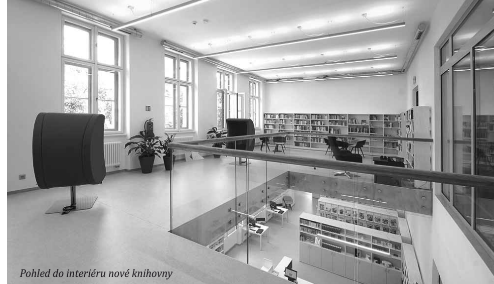
Pohled do interiéru nové knihovny

Pak přišel rok 2013 a s ním myšlenka šéfa odboru investic a tehdejšího starosty města využít pro knihovnu chátrající objekt bývalé základní školy J. A. Komenského. Je na skvělém místě, je dostatečně velký, dobře dostupný veřejnou dopravou i s možností zajistit parkování. Objekt je navíc městský a Kutná Hora pro něj nemá jiné využití. Unese knihovnu?