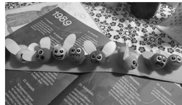
Variace programu pro děti předškolního věku

Prvním subjektem byl Domov pro osoby se zdravotním postižením, který má jako jediné zařízení, se kterým spolupracujeme, takový statut. Většina klientů tohoto zařízení zde žije celoročně, domov nabízí i odlehčovací služby. Dalšími subjekty jsou pak různé denní stacionáře, které pracují s klienty, kteří do zařízení pravidelně docházejí, ale nebydlí v něm.