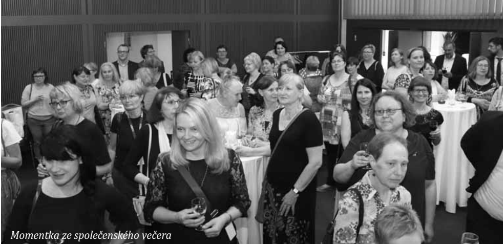
Momentka ze společenského večera