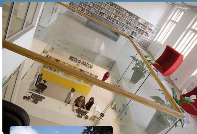
Jak Kutná Hora ke knihovně přišla