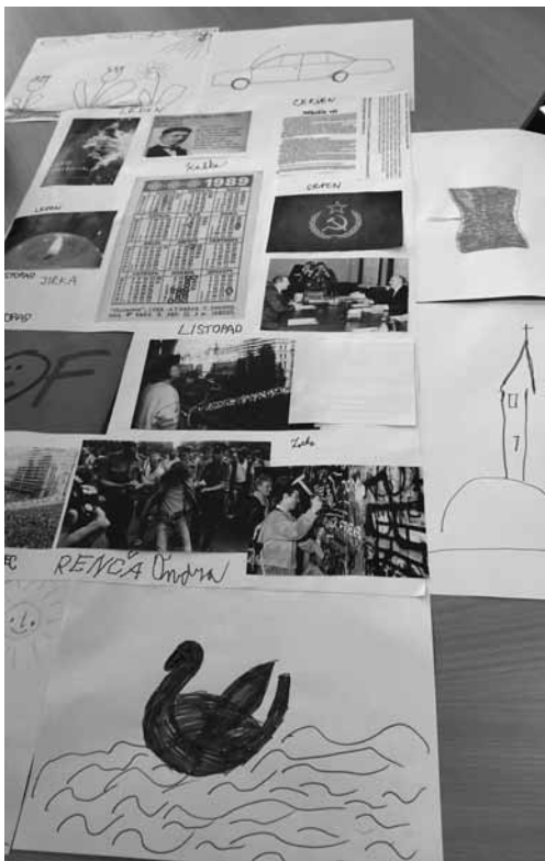
Koláž z programu pro stacionář

Se všemi zařízeními začala spolupráce jednoduchým programem, který v sobě zahrnoval návštěvu stacionáře a seznámení s jeho fungováním a schopnostmi, dovednostmi a projevy klientů, a pak návštěvou knihovny, která seznamovala klienty s tím, jak knihovna funguje. Vytipovali jsme zajímavé obrazové knižní tituly, které by mohly klienty zajímat, případně se podle schopností klientů zvolila i nějaká knihovnická aktivita (třídění knih podle abecedy, přenášení/převážení knih, jejich obalování nebo tvorba knižní záložky nějakou zajímavou technikou).