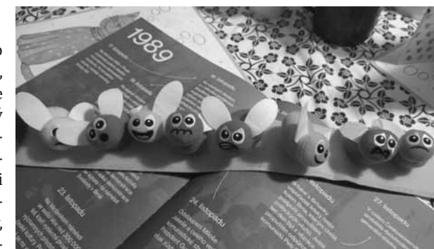
Variace programu pro děti předškolního věku

Prvním subjektem byl Domov pro osoby se zdravotním postižením, který má jako jediné zařízení, se kterým spolupracujeme, takový statut. Většina klientů tohoto zařízení zde žije celoročně, domov nabízí i odlehčovací služby. Dalšími subjekty jsou pak různé denní stacionáře, které pracují s klienty, kteří do zařízení pravidelně docházejí, ale nebydlí v něm.