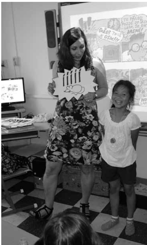
Z komiksově dílny, která se konala ve čtenářském klubu na ZŠ Engel v Brně

nejen soudobou produkcí, ale též historií komiksu a osvětlovat strukturu a jednotlivé prvky komiksového vyprávění.