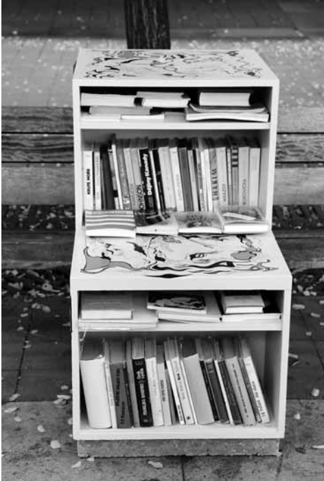
Nová vizuální podoba venkovních knihovniček je dílem výtvarného studia Malujeme jinak

umělci ze studia Malujeme jinak, kteří tento trend v případě své tvorby zaznamenávají. Pokud se na veřejném místě objeví výtvarné dílo, lidé jej prostě neničí. Jinými slovy, my jsme tak vytvořili – jak pevně doufáme – ochranný plášť pro naše knihovny.