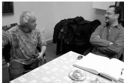
Spoluautor článku s králem českého komiksu Kájou Saudkem (2005)

● Kresbu naskenujte nebo okopírujte. Můžete udělat i více kopií pro případ, že nebudete spokojeni či se dopustíte chyby.