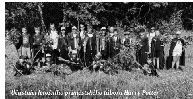
Účastníci letošního příměstského tábora Harry Potter

S příchodem jara jsme začali s realizací venkovních aktivit. Uspořádali jsme Velikonoční šifru , Kamínkovou pátračku a Knižní pátračku , jež se setkaly s velmi kladným přijetím širokou