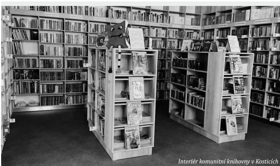
Interiér komunitní knihovny v Kosticích

V knihovně pracuji od února 2021. Předtím jsem působila jako učitelka na Základní škole ve Tvrdomonicích. Komunitní knihovna je pro mě místo, kde se mohu realizovat a naplno rozvíjet svůj potenciál.