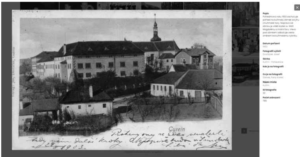
Ukázky obsahu digitální knihovny: pohlednice z roku 1903 (pohled na Kuřimský zámek)...