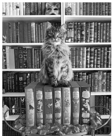
Částími aktéry na fotografiích jsou kočky

Fotografie na bookstagramech jsou nositeli specifické estetické hodnoty, která vyvolává touhu po vlastnění knih a touhu být knihami obklopeni. Takové fotografie běžnou činností, jako je četba knih, romantizují a zkrášlují. K tomu využívají zejména prvky pohodlí, proto je na těchto fotografiích často vidět doplňky jako svíčky, deky, polštářky, pletené svetry, teplé ponožky či horké nápoje. Éra sociálních sítí a všudypřítomného vizuálního vnímání každodennosti proměnila, a tak fotografie knihy na nočním stolku nebo knihovny v pokoji nesou úplně nové významy – nejde už jen o pouhý záznam činnosti, ale i o pocit a dojmy, které obraz vyvolává. Tyto obrazy jsou odrazem změny v našem vnímání; už neukazují jenom věci, jaké jsou, ale k něčemu vybízejí a k ně-