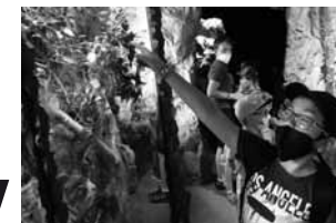
Letos děti navštívily i zoo v Děčíně