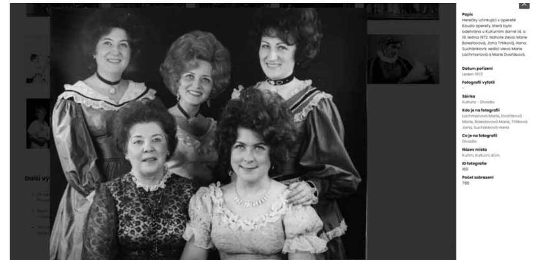
...herečky účinkující v operetě Kouzlo operety (odehráno v lednu 1972)

Veškeré zapůjčené materiály se snažíme zpracovávat přednostně, ale i přes naše snahy se doba výpůjčky pohybuje okolo tří měsíců. Nejčastěji je skenujeme s rozlišením 800 DPI, případně 1200 DPI. Fotky, které se mají používat k propagaci, tedy velkým tiskům, skenujeme na 2400 DPI. Ačkoliv je digitální knihovna primárně zaměřená na obrazové dokumenty, kterými jsou fotografie a pohlednice, veřejnosti nepřístupná část je druhově pestřejší. Obsahuje různé úřední listiny, finanční soupisy hospodaření spolků a seznamy členů, deníkové záznamy či osobní postřehy, dále například zápisky ze schůzí, členské legitimace, plakáty, novinové články,