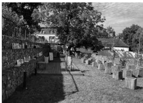
Komunitní zahrada se změnila ve „svět čtenářů“ a očekává své adepty... (červen 2021)

Úspěšný rozjezd knihovny je souhrou mnoha faktorů. Správné načasování, skvělá poloha, spolehlivé příbramské zázemí, díky němuž čtenáři záhy zjistili, že ač je náš knižní fond nesrovnatelně menší, než jsou zvyklí u pražské městské knihovny, máme zajímavé portfolio, na novinky se u nás nečeká věčně a dokážeme sehnat „nesehnatelné“. Zároveň je však nutno konstatovat, že počet knih za dva roky fungování enormně narostl, a to z velké části i zásluhou velkorysé štědrosti místních. Ti jsou nejen štědrí, ale