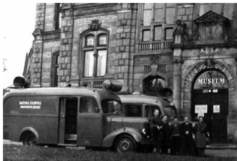
Vozidla pojiždňých knihoven před budovou muzea, kde sídlila i knihovna v roce 1954

Nové možnosti se otevřely až po listopadu 1989. Řada malých poboček ve starých nevyhovujících prostorách na periferii tehdy byla nahrazena deseti zastávkami pojiždňé knihovny. Pokryta byla i sídliště s velkou hustotou obyvatel, kde zájem uživatelů převyšoval kapacity obvodních knihoven. Repasovaný linkový autobus Ka-