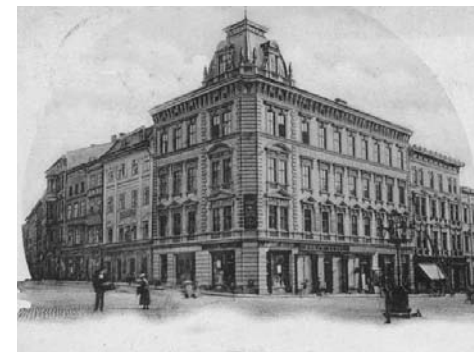
Budova Ústřední rolnické záložny v roce 1900