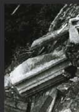
torzo hradního paláce před rekonstrukcí

Hradní knihovna s. 332–335 Před rekonstrukcí a průběh výstavby knihovny