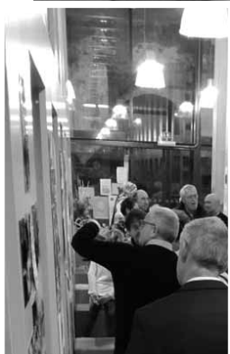
Pohled na knihovnu z horního ochozu a vernisáž u příležitosti výstavy fotografií

prosklená hmota se schodištěm a osobním výtahem do jednotlivých podlaží.