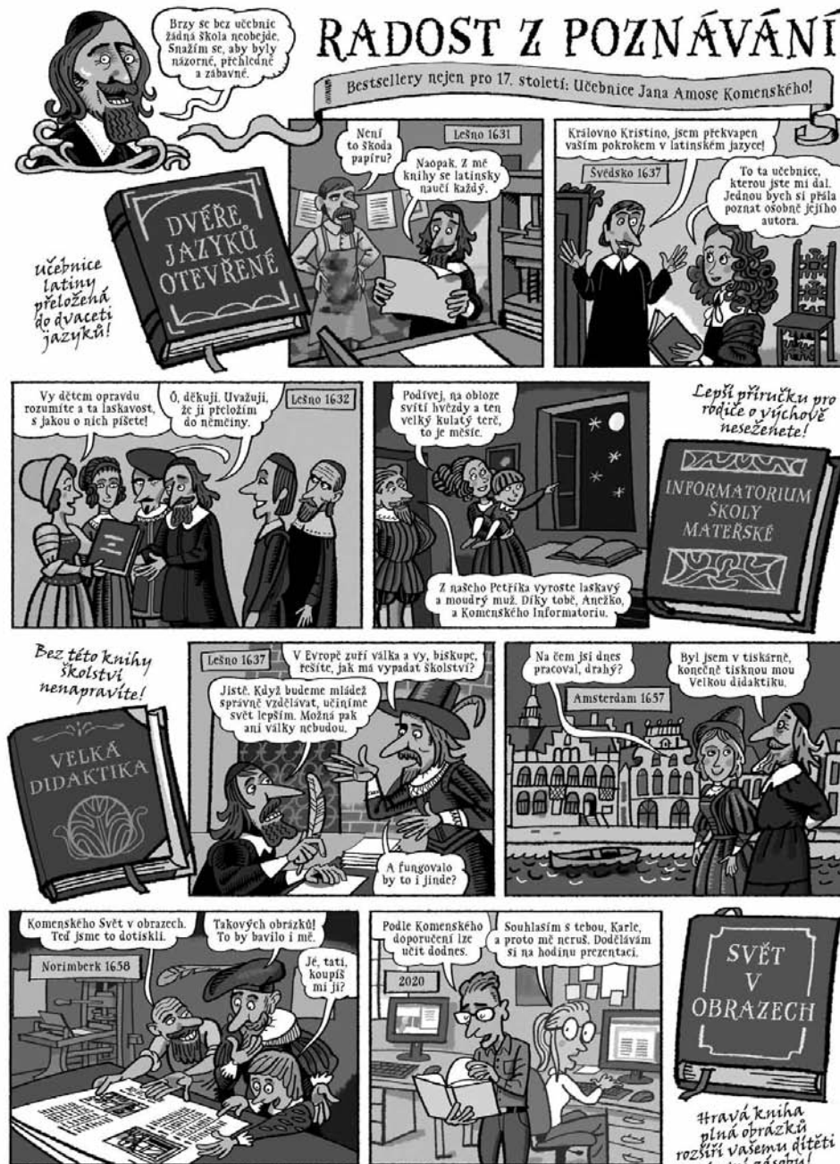
Panel z výstavy Komenský v komiksu na téma Radost z poznávání , text Klára Smolíková, kresby Lukáš Fibrich

Stále platný je jistě apel, že učení musí povzbuzovat spontánnost a jedinečnost jednot-