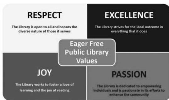
Příklad vizualizace hodnot v Eager Free Public Library

Řada výzkumů potvrzuje, že veřejné knihovny v dnešní době přesahují svoji původní roli. Proto je důležité definovat si základní pojetí významu knihovny esenciální otázkou: Co je to knihovna? (Harland, Stewart, Bruce, 2012). Při samotné definici hodnot si můžeme klást otázky typu: Jaké následky by mělo náhlé přerušení fungování našich služeb, popř. v kterých činnostech je knihovna nezastupitelná? Můžeme si zkoušet odpovědět i na to, kolik času či financí poskytováním svých služeb ušetříme jednomu uživateli, popř. celé komunitě (Oakleaf, 2010).