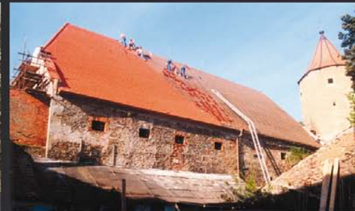
statické zajištění, nový krov a střecha