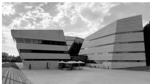
Budova jako z jiné planety – Vědecké komunikační a informační centrum Vilniuské univerzity

Riga je nejen hlavním městem Lotyšska, ale i největším městem v Pobaltí a logicky tu sídlí Národní knihovna Lotyšska (viz foto na 2. s. obálky). Její nová budova byla dokončena v roce 2014 a známá je také jako Palác světla (Gaišmas pils). Její osudy v leccem připomenou příběh Kaplického blobu, ovšem s happyendem. Autorem projektu byl mezinárodně uznávaný lotyšský architekt Gunārs Birkerts, který ale většinu své kariéry působil v emigraci v USA. Budova knihovny je vůbec největším kulturním projektem Lotyšska v 21. století a slouží nejen jako knihovna, ale i jako kulturní, vědecké a vzdělávací centrum metropole. Knihovna se stala výrazem národní hrdosti Lotyšů a její otevření bylo předmětem celonárodních oslav. Přitom výstavba knihovny nebyla vůbec jednoduchá, protože probíhala v době, kdy se Lotyšsko vyrovnávalo s následky těžké ekonomické krize. Ani tehdy však Lotyšští nákladnou výstavbu nezastavili, protože knihov-