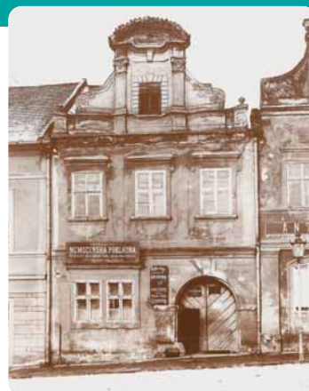
První knihovní zákon – 100 let: Kraj Vysočina s. 404–411

← Městská veřejná lidová knihovna Havlíčkově Brodě sídlila před rokem 1913 v Hanusovském domě na náměstí