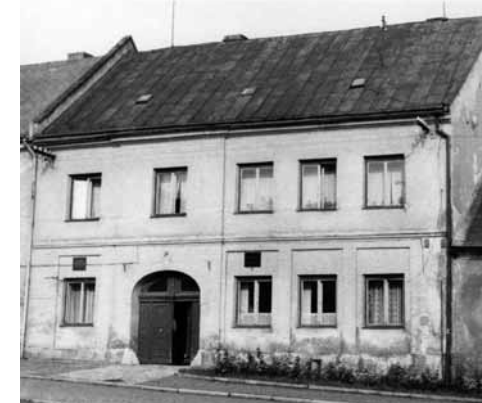
V roce 1946 byla knihovna přemístěna do budovy kampeličky