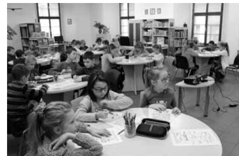
Beseda v Městské knihovně Jihlava