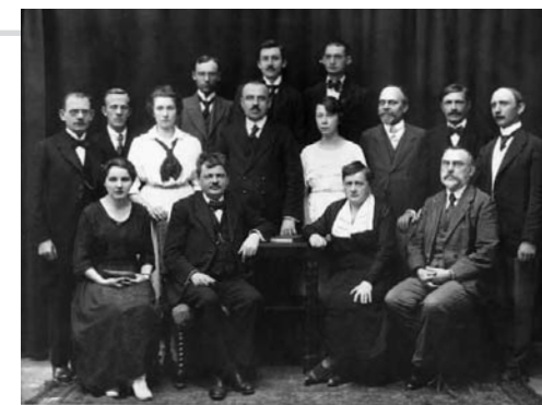
Zakladatelé Československého pedagogického ústavu J. A. Komenského

→ Zakladatelé pedagogické knihovny ji začínali budovat ve dvou místnostech v Rohanském paláci. Těžko si mohli představit, že jednou bude disponovat fondem více než půl milionu svazků v moderně vybavených prostorách, o výpočetní technice ani nemluvě.