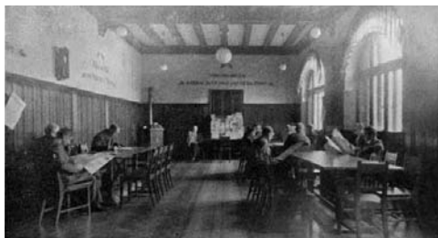
Čítárna německé knihovny v Šumperku (20. léta)

Časem přestávalo být umístění knihovny ve Spielvogelově domě vyhovující. V říjnu roku 1932 byla proto přestěhována do prvního patra tzv. Seidlova domu na rohu tehdejšího Marktplatz (dnes náměstí Míru), kde sídlila ještě v prvních letech 2. světové války.