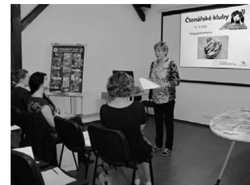
Momentka ze setkání školních knihovníků

Od 60. let můžeme pozorovat postupně rozšiřování příkopu mezi mezinárodním vývojem ve školním knihovnictví a vývojem v socialistickém Československu. Ovšem v žádném případě se nedá říci, že by stát školní knihovny systematicky zanedbával. Porovnáním stavu československých