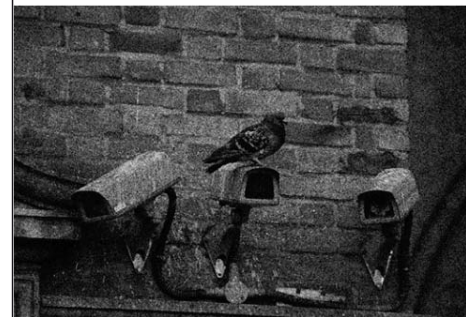
Z cyklu Mrtvé weby

Uživatel se musí dostavit do Referenčního centra v budově Klementina. Vzhledem k tomu, že samotná data bez souhlasu vydavatelů tedy Webarchiv volně zveřejňovat nemůže, hledá cesty, jak je z archivu vytěžovat. Aktuálně pracujeme na projektu, který řeší, jak obsah jednoduše zpřístupňovat badatelům prostřednictvím metadat, která by jim mohla poskytovat relevantní informace pro další bádání.