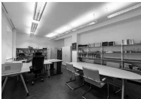
Pohled do interiéru Sukovy knihovny

Sukova knihovna je kolektivním členem Společnosti přátel literatury pro mládež a České sekce IBBY, která spolu s Obcí spisovatelů každoročně pořádá soutěž Zlatá stuha a oceňuje nové knihy pro děti. Podílí se na organizaci soutěže, poskytuje zázemí odborným porotám, shromažďují se zde také hodnocené knižní tituly.