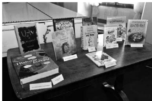
Kolekce vítězných titulů za rok 2011

První dvě ceny jsou anketní; vyhlašují se vždy tři tituly s nejvyšším počtem získaných hlasů. Cena učitelů se uděluje na základě rozhodnutí poroty složené z učitelů českého jazyka. Může ji získat maximálně pět novinek od českých autorů, které vyšly v příslušném kalendářním roce v prvním vydání. Cenu Noci s Andersenem získá nejčtenější titul během stejnojmenné akce.