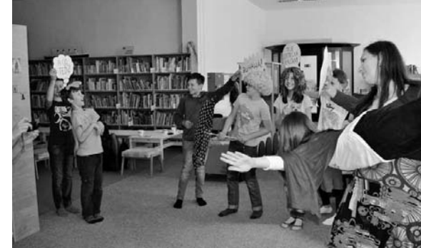
Momentka z akce v prostějovské knihovně

Někdy nás překvapí už uvítání. Když na Moravě uslyšíte Vítáme vás v Čechách , je jasné, že něco nehraje. Že bychom špatně zadali cíl cesty do navigace? Naštěstí se ukázalo, že nevelká obec na Hané se jmenuje Čechy pod Košířem. Olomoucký kraj se rozpráhne od zmiňovaného Javorníku po hanáckou nížinu.