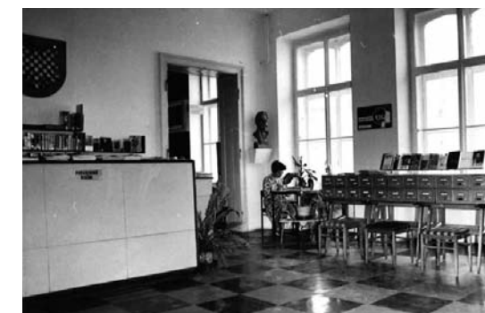
Oddělení pro dospělé (70. léta)

Práce knihovníků se soustředila na práci se čtenářskou obcí. Pořádaly se besedy jak pro děti, tak pro dospělé. Vznikaly k nim i doprovodné texty – jednak metodická podpora pro ostatní knihovníky, jednak bibliografické brožurky pro veřejnost. Přibližování čtenářů je patrné například z toho, že se vytvářely tematické seznamy literatury nebo že byl v roce 1950 zaveden tehdy novátorský volný výběr. Do obcí, v nichž nebyla lidová knihovna, jezdil bibliobus, v roce 1952 vzniklo samostatné hudební oddělení. Během následujících desetiletí se knihovna stala významným pomocníkem státu při zvyšování zájmu veřejnosti o nejrůznější politické a kul-