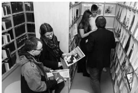
Čtenáři ve všeobecné studovně NPKK