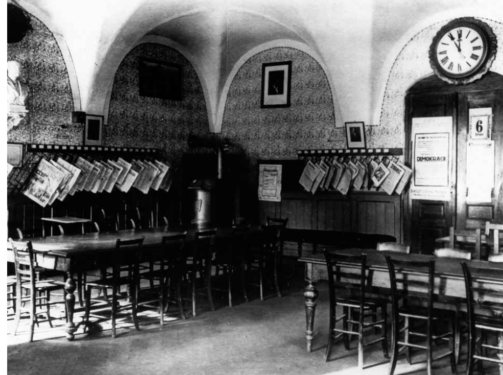
Čítárna městské knihovny v Salmově paláci v roce 1921

V říjnu 1947 byl radou po dlouhých peripetiích schválen návrh přenechat městské knihovně