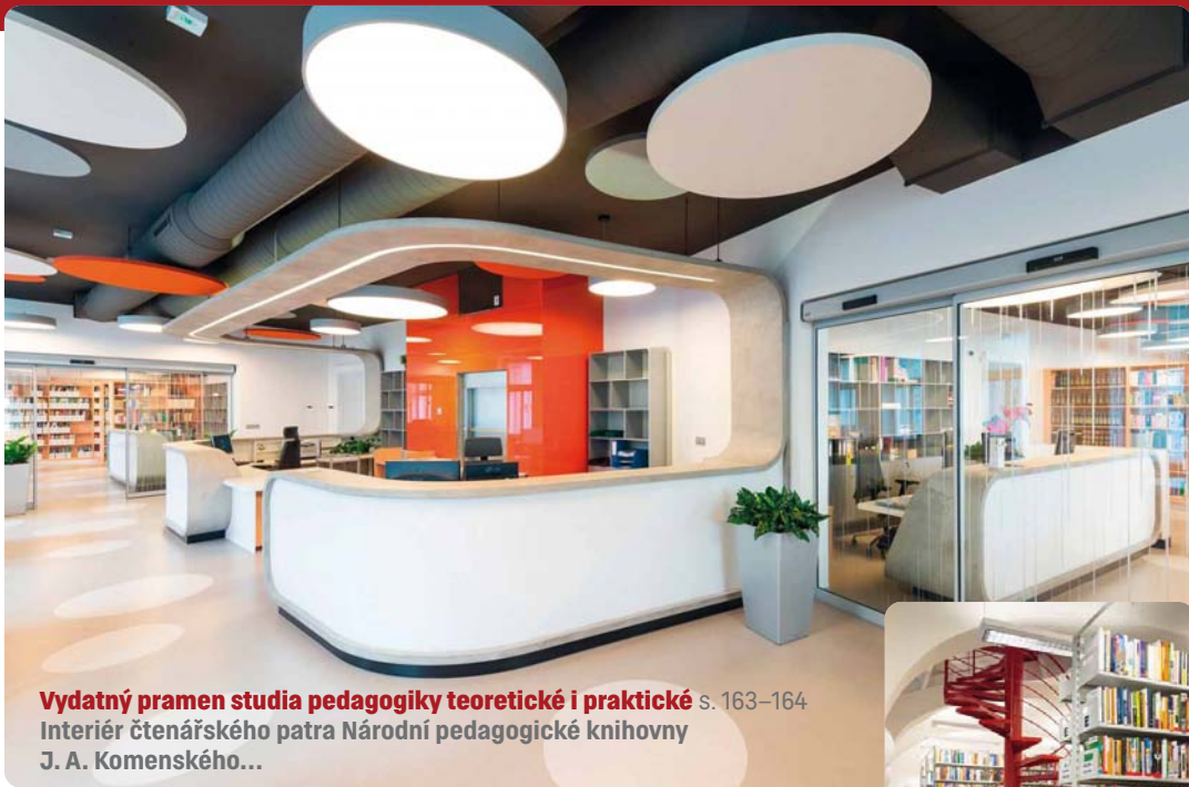
Vydátný pramen studia pedagogiky teoretické i praktické s. 163–164 Interiér čtenářského patra Národní pedagogické knihovny J. A. Komenského...