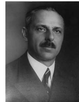
V. F. Suk (1883–1934)