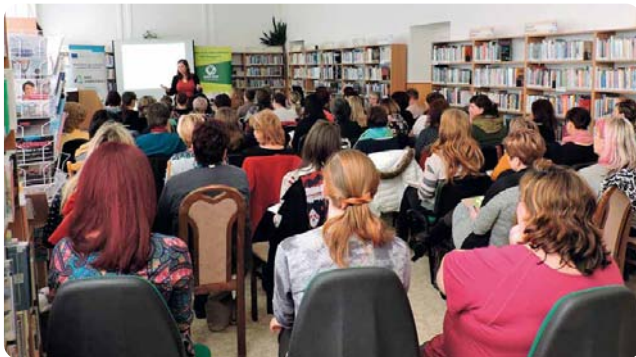
Cesty uskutečněné a cesty virtuální s. 196–198 ↑ Seminář o čtenářské gramotnosti vedený K. Smolíkovou v Městské knihovně Zábřeh v únoru 2019