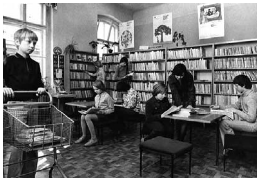
Dětské oddělení (70. léta)

Prioritou zůstávají děti od nejútlejšího věku. Projekt Bookstart přivádí nové zájemce o knížky a čtení. Čtenářskou gramotnost rozvíjejí besedy na různá témata, knihovnické lekce a aktivity typu Knížka pro prvňáčka , Pasování na čtenáře , Noc s Andersenem či Den pro dětskou knihu . Daří se cílit i na věkovou skupinu středoškoláků – počet tříd přicházejících do knihovny na zajímavé interaktivní besedy se zvyšuje.