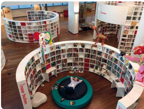
→ ...a nový sklad knih