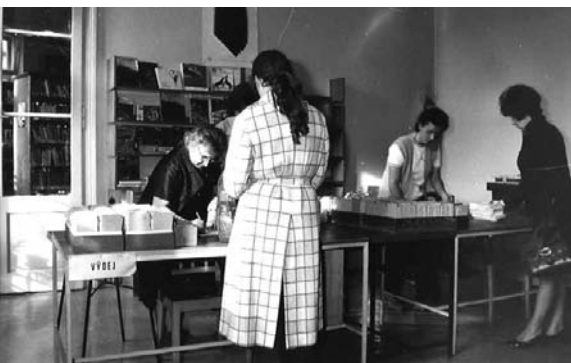
Příjem a výdej knih probíhal v roce 1972 za ještě dosti primitivních podmínek

Protože se knihovnictví v Olomouci vždy snažilo jít s dobou, brzy po nástupu počítačové techniky se Okresní knihovna v Olomouci pustila do první fáze automatizovaného zpracování fondu v knihovnickém programu, a to od roku 1993. Od roku 1997 se čtenářům zpřístupnil on-line katalog, o rok později byl zaveden také veřejný internet.