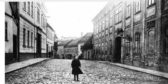
Česká veřejná knihovna v Šumperku sídlila v dnešní ulici Generála Svobody (v budově vlevo)

Město Šumperk převzalo knihovnu do své správy v roce 1920. Podle výše uvedeného zákona bylo povinno přispívat na její provoz částkou odvozenou z počtu obyvatel. V té době zde žilo více než 13 000 obyvatel, z toho ovšem necelé dva tisíce tvořili Češi, kteří si vybudovali vlastní knihovnu, o níž bude pojednáno později. Správu německé městské knihovny, otevřené oficiálně