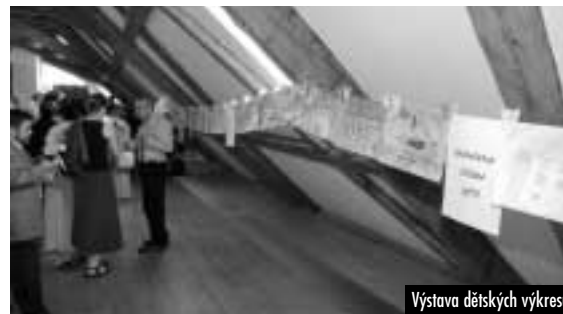
Výstava dětských výkresů