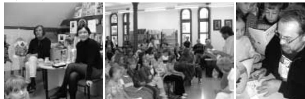
Besedy dětí s autory

Situace se mírně zkomplikovala, když si město Uherské Hradiště vyžádalo návrat historického majetku (objekt se stal kulturní památkou) a knihovna, stále zařízení okresního úřadu, se