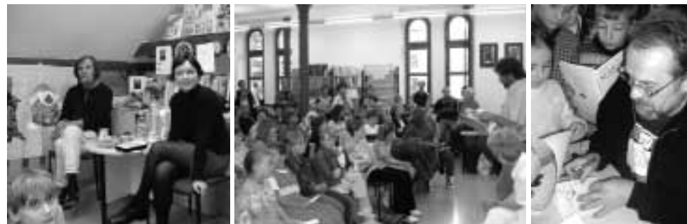
Besedy dětí s autory

Situace se mírně zkomplikovala, když si město Uherské Hradiště vyžádalo návrat historického majetku (objekt se stal kulturní památkou) a knihovna, stále zařízení okresního úřadu, se