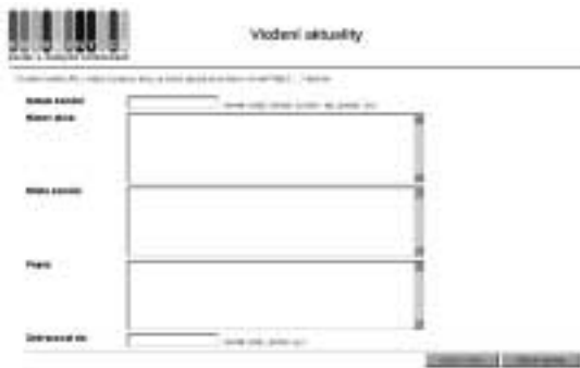
Formulář pro vkládání nových akcí do systému

Portál nabízí na svých stránkách jednoduchý nástroj, jehož prostřednictvím je možné shromažďovat informace o veřejných akcích knihoven. Na úvodní stránce portálu naleznou knihovny odkaz na formulář pro vložení nové akce. Zveřejnění akce na portálu podléhá formálnímu schválení administrátora. Systém automaticky odstraňuje z nabídky již uskutečněné akce.