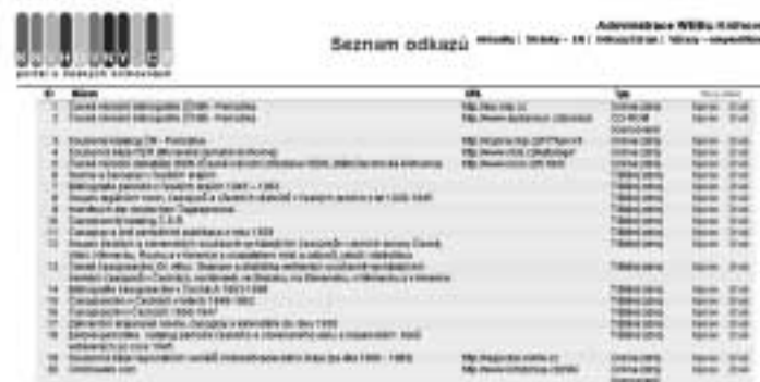
Ukázka administrace databáze zdrojů

Informace o zdrojích jsou na portálu uloženy v databázi, která obsahuje vždy název zdroje, jeho typ, charakteristiku zdroje a případně URL. Ve veřejně přístupné části portálu se tyto informace objeví při najetí myši na název zdroje. Přístup k administraci databáze zdrojů je možný pouze na základě přístupového hesla.