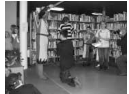
Pasování na Rytíře krásného slova

Nechyběla ani prohlídka hradu. Ve věži jsme navštívili červeného mužíčka, rytíře i bílou paní, kteří střeží poklady na hradě ukryté (alespoň tak praví pověsti), na nádvoří jsme si vyzkoušeli mučící nástroje a pak prozkoumali i hradní sklepení, které je domovem ježibab a čarodějnic. Všechny jmenované „dámy“ vypadaly dost podivně, vydávaly hrůzostrašné zvuky a snažily