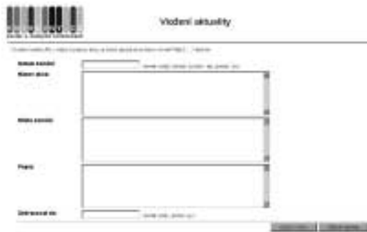
Formulář pro vkládání nových akcí do systému

Portál nabízí na svých stránkách jednoduchý nástroj, jehož prostřednictvím je možné shromažďovat informace o veřejných akcích knihoven. Na úvodní stránce portálu naleznou knihovny odkaz na formulář pro vložení nové akce. Zveřejnění akce na portálu podléhá formálnímu schválení administrátora. Systém automaticky odstraňuje z nabídky již uskutečněné akce.