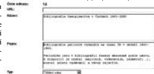
Ukázka popisu vybraného zdroje v administraci

Současný stav portálu, jeho struktura a obsah nejsou konečné. Předpokládáme, že na základě došlých připomínek se bude dále vyvíjet. Pro pracovníky knihoven byl portál zveřejněn v únoru letošního roku, pro laickou veřejnost v rámci BMI 2005. Podle nás je zatím příliš brzy hodnotit užitečnost portálu, z jednotlivých reakcí je však již zřejmé, že takto souhrnně podané informace jsou potřebné, a to nejen pro nejširší veřejnost.