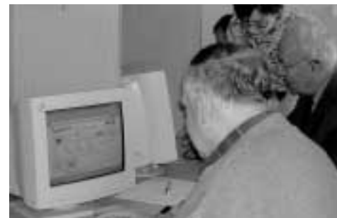
Rychlé připojení k internetu

Daleko náročnější byl následující projekt určený dětem, pro které slovo četba znamená noční můru, projekt pro děti se speciálními poruchami učení. Knihovna se do svých služeb rozhodla zařadit péči o ty děti, jejichž nečtenářství má svůj důvod ve vývojové dyslexii. Děti s obdobnými problémy je v současné době diagnostikováno stále více. Projekt reedukace dyslektiků „Hrajeme si v knihovně aneb Čtenářská