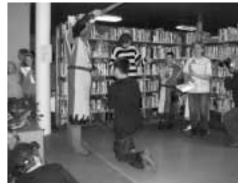
Pasování na Rytíře krásného slova

Nechyběla ani prohlídka hradu. Ve věži jsme navštívili červeného mužíčka, rytíře i bílou paní, kteří střeží poklady na hradě ukryté (alespoň tak praví pověsti), na nádvoří jsme si vyzkoušeli mučící nástroje a pak prozkoumali i hradní sklepení, které je domovem ježibab a čarodějnic. Všechny jmenované „dámy“ vypadaly dost podivně, vydávaly hrůzostrašné zvuky a snažily