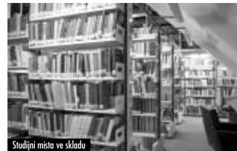
Studijní místa ve skladu

knihovna Chorvata Milana Rešetara čítající cca 3000 jednotek zabývajících se tematikou Dubrovniku. Stejným způsobem získala knihovna kolekci cca 12 000 svazků knihovny významného petrohradského knihkupce a vydavatele první poloviny 19. století Alexandra Filipoviče Smirdina. Velké téma, které proslavilo knihovnu po celém světě, představuje problematika politické meziválečné emigrace z území bývalého Sovětského svazu. Několik osobních knihoven darovaných emigranty (např. V. Tukalevským) tvořilo samotný základ tehdy Ruské knihovny v roce 1924. Časem byla Slovanskou knihovnou shromážděna ohromná kolekce knih, časopisů a novin, vydávaných po celém světě