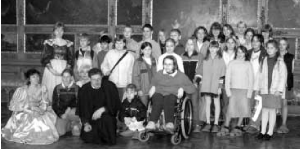
Společné foto dětí s historickými postavami