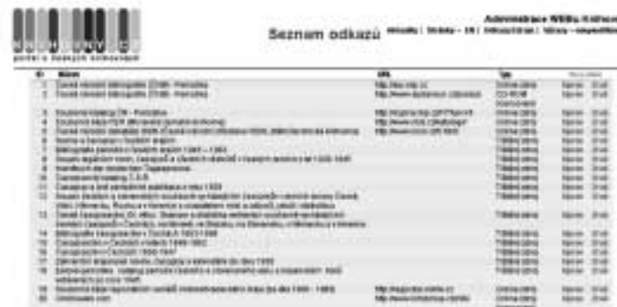
Ukázka administrace databáze zdrojů

Informace o zdrojích jsou na portálu uloženy v databázi, která obsahuje vždy název zdroje, jeho typ, charakteristiku zdroje a případně URL. Ve veřejně přístupné části portálu se tyto informace objeví při najetí myši na název zdroje. Přístup k administraci databáze zdrojů je možný pouze na základě přístupového hesla.