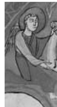
Detail z Evangeliáře zábrdovického

Svatovítská apokalypsa má s Evangeliářem zábrdovickým společnou nejen vnější podobu, nýbrž podle všeho i bavorský původ, dobu vzniku na rozhraní raného a vrcholného středověku a pozdější osudy. Liší se hlavně tím, jak velký či malý zájem o ně odborníci dosud projevíli, a také uložením – prvně jmenovaná kniha je chována v Archivu Pražského hradu, druhá ve Vědecké knihovně v Olomouci. Možná právě díky tomuto rozdílnému uložení je Apokalypsa podstatně známější – zmiňuje se o ní každý přehled středověkého umění v českých zemích, zato Evangeliář je pravidelně opomíjen, zejména v novější odborné literatuře. Přitom uložení obou v českých zemích je datováno od sklonku středověku. Kdysi byly oba rukopisy součástí pražské Kapitulní knihovny. Evangeliář se později dostal na Moravu a do konce 18. století byl chován v premonstrátském klášteře v Zábr-