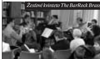
Zestové kvinteto The BarRock Brass

nalá. V oddělení pro děti všechny překvapil velký pytel, který tam pohodil čert – vášnivý, ale nepořádný čtenář. Protože ale všichni vědí, že čerti z českých pohádek jsou spíše pro legraci než pro strach, nebály se ho ani děti a čile s ním diskutovaly. O Knihvypůjčce regálové už jsem se zmínila.