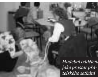
Hudební oddělení jako prostor přátelského setkání

Ve vstupní hale byl otevřen prodejní stánek výrobků žáků Soukromé mateřské, základní a střední školy Slunce v Kladně, která vzdělává v kladenském regionu děti všech věkových kategorií se speciálními potřebami. Zástupcům této školy jsme nabídli využití počítače pro slabozraké a nevidomé – mají dva žáky s tímto postižením.