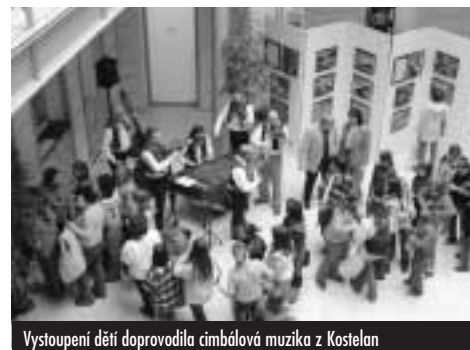
Vystoupení dětí doprovodila cimbálová muzika z Kostelana

Cesta knihovny k získání konkurenční výhody vede přes odlišení nabízených služeb poskytováním nebo přidáním některých speciálních služeb, kteří nejsou standardem v daném odvětví nebo pro danou skupinu zákazníků. Může jít o různé poradenské služby, přednášky, školení (kurzy práce s počítačem s internetem...), dětské programy (hodinky s předčítáním, prázdninové aktivity, soutěže, dílny...), poskytování prostor knihovny pro různá setkání společenských skupin, spolupodílení se na pořádání místních aktivit (výročí prvních písemných zmínek o městě či jiné historické události, pořádání výstav v prostorách knihovny...), vytvořit klub přátel knihovny apod.