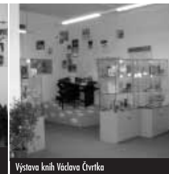
Výstava knih Václava Čtvrta