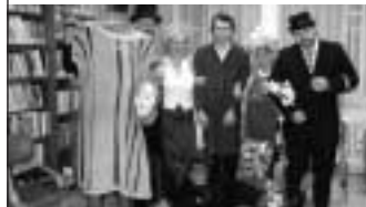
Průvodci po knihovně

Následoval výstup po točitém schodišti na půdu, odkud se ozývaly tajuplné zvuky. Návštěvníci se zatajeným dechem (hlavně ti mladší) vyslechli starozlínskou pověst o rytíři Milošovi, který mečem setnul hlavu obdivované dívky Lidušce, jež ho odmítla, a rytíř za trest musí po smrti chodit s hlavou pod paží. Když se pak bezhlavý rytíř s narikáním „Liduško, Liduško“ objevil, byla iluze doko-