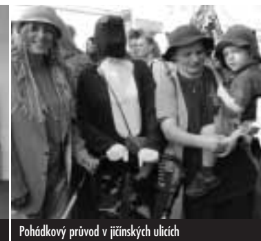
Pohádkový průvod v jičínských ulicích