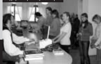
U výpůjčního pultu bylo stále plno

Návštěvníky zaujala i výstava regionálních dokumentů (knihy, seriály) ve studovně. Na počítači tu byla v provozu „smyčka“ informací o kulturních zařízeních a pamětihodnostech Středočeského kraje. Domů si odnášeli brožury vydané Středočeským krajem Muzea, galerie, ostatní kulturní zařízení i letáky vytvořené SVK Střední Čechy na webu .