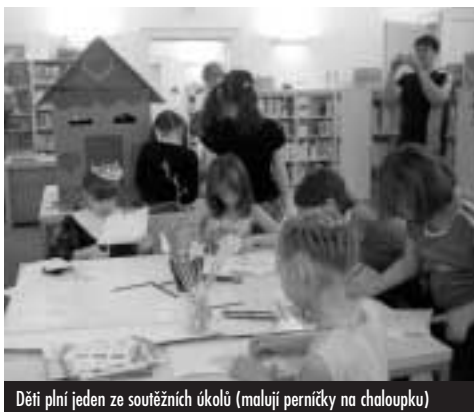
Děti plní jeden ze soutěžních úkolů (malují perníčky na chaloupku)