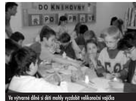
Ve výtvarné dílně si děti mohly vyzdobit velkonoční vajíčka