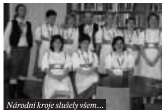
Národní kroje slušely všem...

V sobotu 28. října 2006 byla ve středních Čechách otevřena veřejnosti všechna muzea, galerie a další kulturní zařízení, která má Středočeský kraj ve své správě. Vstup pro návštěvníky byl zdarma.