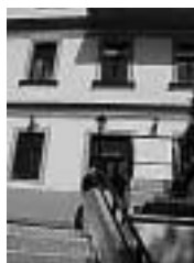
Budova ústředí Starokatolické církve, v níž se nachází Starokatolická knihovna v Praze, pochází z doby první republiky, vyhořela a byla výhodně prodána Starokatolické církvi pod podmínkou, že bude zrekonstruována do původní podoby.

Archiv byl založen v roce 1993 společně s biskupským vikariátem, který byl v roce 1996 povýšen na apoštolský exarchát.