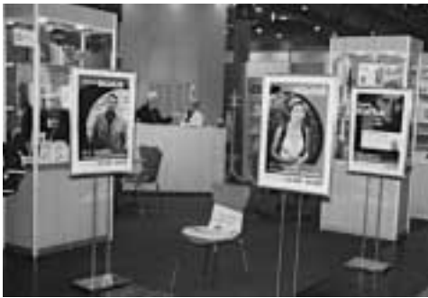
Lipský knižní veletrh, český stánek