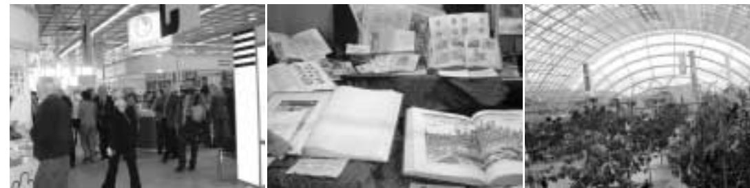
Knižní veletrh intelektuální literatury v Moskvě

Pokud si potřebujeme vytvořit ucelený obrázek knižní produkce v anglickém jazyce, a to především z britských (včetně těch menších), ale i severoamerických nakladatelství, stojí za to se vypravit na mezinárodní knižní veletrh v Londýně : http://www.lbf-virtual.com/ , který se také koná v březnu. Je to poměrně velký veletrh (v roce 2006 se zde očekává více než 1900 vystavovatelů) s tradicí od roku 1972. Mezinárodní obchodní charakter dostal ale až po roce 2000, kdy se stal evropským centrem prodeje autorských práv v oblasti angloamerické knižní produkce. Vedle literárních čtení, přednášek a seminářů lze na veletrhu absolvovat kurz tvůrčího psaní a být u vyhlášení vítěze soutěže