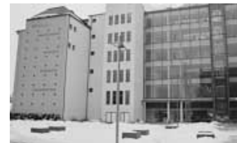
Městská knihovna v Chemnitzu, kulturní středisko DASTietz