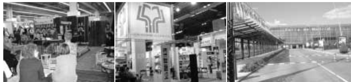
Autorské čtení na veletrhu ve Frankfurtu

Největším, nejdůležitějším a vlastně nejstarším evropským veletrhem je Mezinárodní knižní veletrh ve Frankfurtu nad Mohanem (první zmínky o frankfurtském trhu pocházejí z roku 1150), který se koná každoročně vždy v říjnu ve veletržním areálu kousek od frankfurtského Hlavního nádraží. Má velkou tradici – knižní veletrh pak od roku 1949 – a každý rok přiláká tisíce vystavovatelů z více než sta zemí a stovky tisíc návštěvníků. V roce 2005 se zde prezentovalo přes 7200 vystavovatelů z 101 zemí světa. Veletrh má velmi přehledné webové stránky http://www.buchmesse.de , kde se mimo jiné můžete přihlásit jako odborný návštěvník a s předstihem si zakoupit permanentní