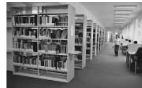
Studijní místa a volný výběr dokumentů

Jedna věc je stavět jakoukoli novostavbu na „zelené louce“, jiná rekonstruovat starou budovu. Můžeme potvrdit, parafrázujíc kterýkoliv z Murphyho zákonů, že když se něco nemá najít, tak se to najde. Zdatní archeologové zbytky jakési hospodářské stavby ze 16. století na parcele pod Lisztovou zahradou skutečně našli, ačkoli geologické a geofyzikální sondy to