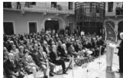
Otevíření knihovny 17. 4. 2005

Standardní předprojektová a projektová fáze každé investice vyžaduje obvykle více času, který v tomto případě nebyl k dispozici. Etapa přípravných prací (průzkumy, projekty, veřejné zadávání) byla opravdu krátká, avšak delší vzhledem k plánovanému termínu realizace. Bylo nutné vystěhovat, přemístit a přestavět asi dva miliony knih, což do té doby na Slovensku a ještě ke všemu za provozu, nikdo nedělal. Stavební práce začaly v srpnu 2002, ale až do dubna 2003 se knihy půjčovaly a studovny fungovaly, i když to probíhalo v prostředí zvyšují-