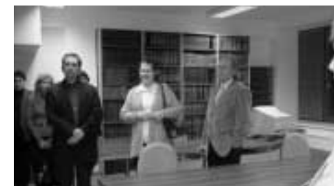
Nahoře: olomoucká konference je tradičním místem setkávání knihovníků, historiků a archivářů. Dole: součástí programu byla i prohlídka nových studoven knihovny