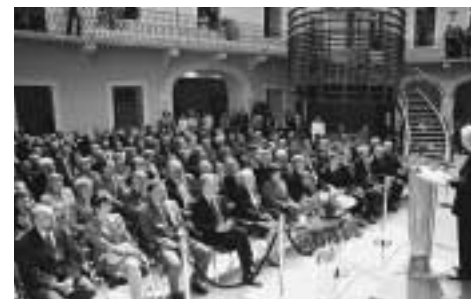
Otevření knihovny 17. 4. 2005

Standardní předprojektová a projektová fáze každé investice vyžaduje obvykle více času, který v tomto případě nebyl k dispozici. Etapa přípravných prací (průzkumy, projekty, veřejné zadávání) byla opravdu krátká, avšak delší vzhledem k plánovanému termínu realizace. Bylo nutné vystěhovat, přemístit a přestavět asi dva miliony knih, což do té doby na Slovensku a ještě ke všemu za provozu, nikdo nedělal. Stavební práce začaly v srpnu 2002, ale až do dubna 2003 se knihy půjčovaly a studovny fungovaly, i když to probíhalo v prostředí zvyšují-