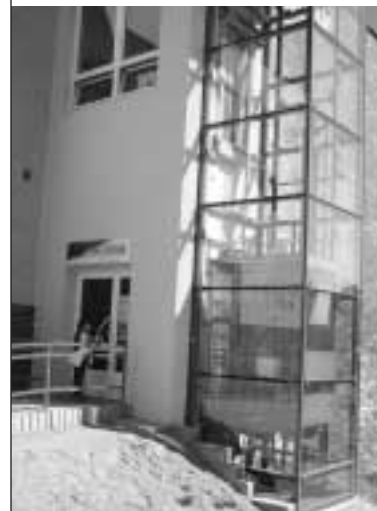
Bezbariérový přístup do Obvodní knihovny Plzeň-Lochtín s dominantou proskleného bezbariérového výtahu

věnujeme zvýšenou pozornost. Jejich dotazy a požadavky patří k nejnáročnějším. Snažíme se jim ve všech směrech vyhovět, pomáháme jim s vypracováním referátů i odborných a vědeckých prací. Pro děti ze základních a mateřských škol pořádáme výchovné lekce, exkurze a besedy o knihovně a knihách. Připravujeme pro ně zajímavé soutěže o ceny, které jsou velkou motivací k návštěvě knihovny a také ke čtení knih.“