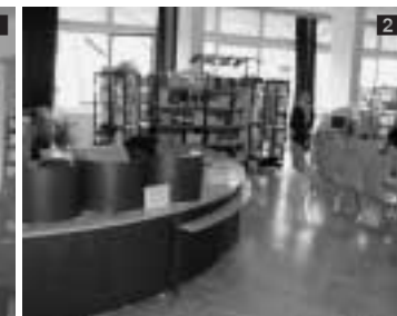
1 Centrální místnost Knihovny pro mladé Romy Gándhího gymnázia v maďarské Pécsi, Maďarsko (červen 2005)