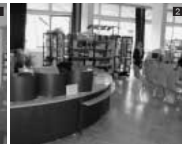
1 Centrální místnost Knihovny pro mladé Romy Gándhiho gymnázia v maďarské Pécsi, Maďarsko (červen 2005)