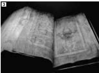
1 Antiphonarium monasterii S. Georgii, ČR