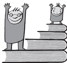
ROSTEME S KNIHOU

Na veletrhu Svět knihy Praha 2007 byly i letos předány ceny Zlatá stuha za nejlepší knihy pro děti a mládež, jež jimž vyhlásovatelem jsou společně Česká sekce IBBY, Obec spisovatelů, Klub ilustrátorů dětské knihy a Obec překladatelů. Letos poprvé byla vedle ocenění v části zaměřené na oblast původní české tvorby pro děti a mládež, na oblast překladovou a výtvarnou, udělena nová cena s názvem Rosteme s knihou v rámci stejnojmenné kampaně, kterou organizuje společnost Svět knihy.