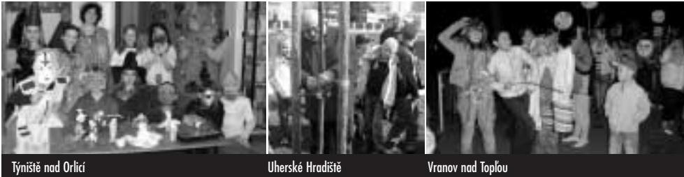
Týniště nad Orlicí