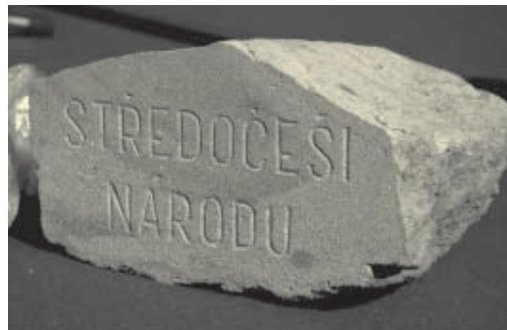
(Poděkování za pomoc a spolupráci Jakubu Pavlíkovi včetně použití jeho textu.)

Kámen Žehrovák, který je součástí tolika staveb úzce spjatých s životem a kulturou našeho národa, proto podle Jakuba Pavlíka a knihoven a knihovníků Středočeského kraje nesmí chybět ani v základech nové budovy Národní knihovny ČR, i když bude provedena z moderních stavebních materiálů. Bude symbolizovat i kontinuitu činnosti kulturních zařízení v naší zemi a knihoven zvlášť.