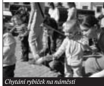
Chytání rybiček na náměstí

a místostarostka města, předvedly děti pohádku o broučcích a pěvecký soubor Cvrčci zazpíval několik písní. Mezitím se setmělo. Rodiče dětem rozsvítili lampióny a průvod berušek, motýlků a různých broučků s lampióny v ruce se vydal do areálu „na hradech“, kde