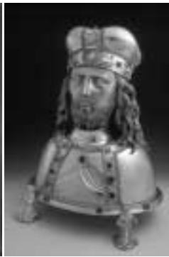
Ostailková busta sv.Václava