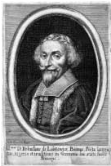
Portrét Bohuslava Hasištejnského

Ráda bych vysvětlila, proč jsme se pro dané téma rozhodli a proč se taková výstava koná právě na Pražském hradě. Prvním důvodem byla skutečnost, že Bohuslav přináležel k významnému českému šlechtickému rodu, jehož příslušníci ovlivňovali dění v českých zemích. On sám, vybaven vynikajícím vzděláním, působil v královské kanceláři Vladislava Jagellonského. Prakticky po celý život byl v kontaktu jak se samotným králem, tak s vysokými úředníky jeho kanceláře. Doba, ve které se to vše