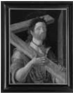
Lorenzo Costa – Kristus