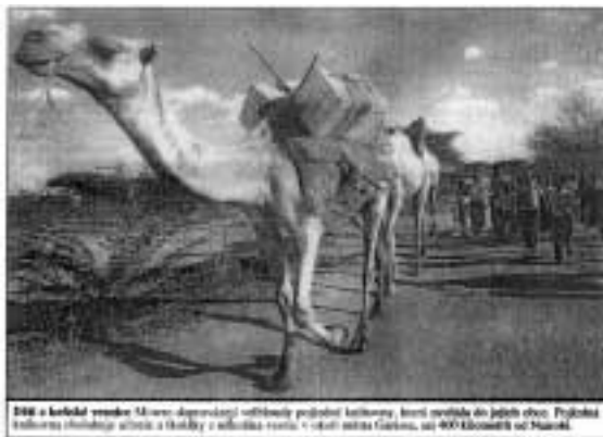
Dokonalá knihovna – Dromedárotéka

Mobilní knihovna, kterou tvoří vždy tři velbloudi, navštěvuje každou osadu dvakrát měsíčně a každý velbloud má přesně určeno, co