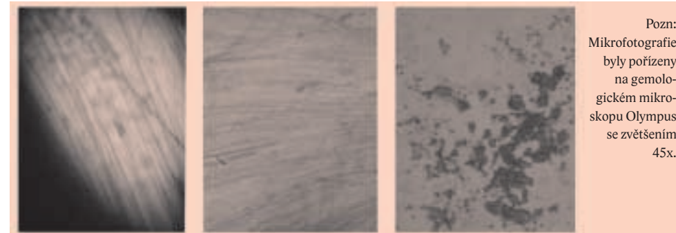
Pozn: Mikrofotografie byly pořízeny na gemolo- gickém mikro- skopu Olympus se zvětšením 45x.