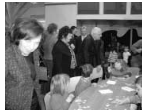
Prezident se svou chotí na besedě s dětmi mateřských škol

Zdá se, a dosažené výsledky to potvrzují, že první rok fungování nové budovy Krajské knihovny byl dobrý. Je však spravedlivé dodat, že vedle jejich nesporných předností a kvalit mají zásluhu na dosažených výsledcích nejméně tři další podstatné faktory. Na prvním místě musím jmenovat zaujetí celého pracovního týmu pro práci a identifikaci se strategickými cíli knihovny. Určitou hrdost na to, že pracují v progresivně vybavené a fungující instituci nelze přehlédnout. Druhým zdrojem dosavadního úspěchu je soulad nabídky služeb s požadavky veřejnosti, která vnímá knihovnu