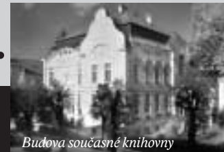
Budova současné knihovny

K výročí knihovny jsme připravili výstavu o historii její činnosti.