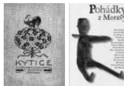
Kytice Františka Bartoše a Pohádky z Moravy