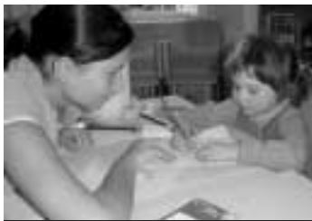
Děti si mohly malovat nebo vyzkoušet pletení pomlázky