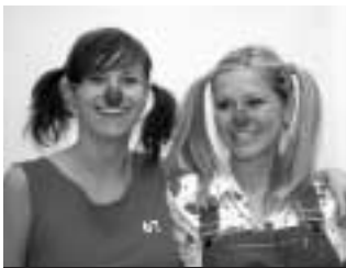
Příprava na maskární bál