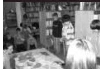
Děti ze ZŠ Kamenná stezka házejí kostkou ve hře Putování za pokladem kapitána Černovouse

Začátkem listopadu 2006 navštívili naše dětské oddělení Městské knihovny Kutná Hora zástupci nakladatelství THOVT, které se zaměřuje na vydávání literatury