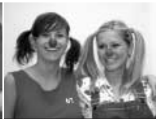
Příprava na maskární bál