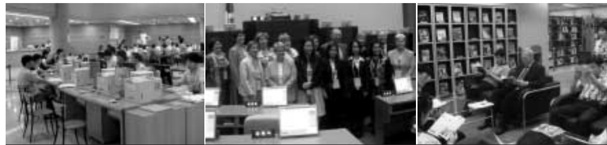
Knihovna Národního shromáždění v Soulu – výpůjční protokol knihovny / účastníci předkonference v jednacím sále knihovny / čítárna knihovny

Nejvíce však na nás zapůsobil – a to bylo druhé překvapení – plně automatizovaný výpůjční systém na bázi technologie RFID. Knihy, kterou si čtenář vypůjčil buď ve volném výběru, nebo i v depozitáři, se vůbec nedotkla knihovnickova ruka. V prvním případě se klient samoobslužnými výpůjčními jednotkami obsloužil sám a v druhém ho obsloužil RFID vyhledávací systém, který podle čtenářova požadavku v OPACu zpřístupnil příslušnou uličku mezi kompaktními regály, automatizovaná mechanická ruka volně pojiždějící nad regály našla a vyjmula příslušný dokument, který položila do kontejneru na dopravníkový pás mezi regály a ten knihu dovezl během deseti minut k čekajícímu klientovi do výpůjčního protokolu. Zdráhám se uvěřit, že by systém neměl své mouchy, ale pro krátkost návštěvy se mi nepodařilo žádnou objevit.