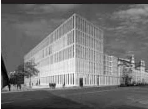
Sídlo Univerzitní knihovny Humboldtovy univerzity v Jacob und Wilhelm Grimm – Zentrum

Abych nebyl mylně pochopen, mé konstrukce nemají sloužit jako argument pro návrat ke starým, osvědčeným a krásným stavbám, abychom se vyvarovali nespolehlivosti hodnotících kritérií dnešní architektury. Mnohem více je naším úkolem nacházet „nové“ z naší doby a techniky vycházející formy a návrhy, které budou stejně tak krásné, jako trvalé. Existuje postup, podle kterého bychom mohli, jednotlivci či grémia, systematicky eliminovat rozdílné normy hodnocení, a poté dojít k uváženému rozhodnutí? Jaké normy a vlastnosti to jsou pro veřejnou stavbu, např. knihovnu? To, že pro architektky ztvárnění stavby a urbanizační aspekty mají a musejí mít prioritu, je