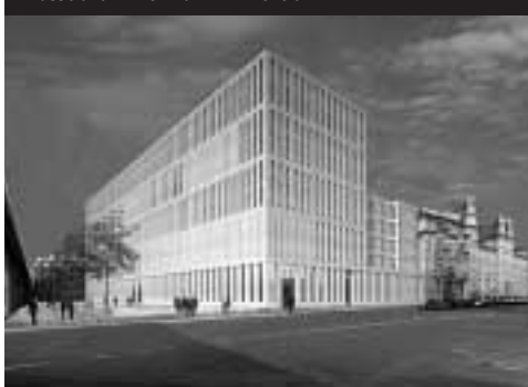
Sídlo Univerzitní knihovny Humboldtovy univerzity v Jacob und Wilhelm Grimm – Zentrum

Abych nebyl mylně pochopen, mé konstrukce nemají sloužit jako argument pro návrat ke starým, osvědčeným a krásným stavbám, abychom se vyvarovali nespolehlivosti hodnotících kritérií dnešní architektury. Mnohem více je naším úkolem nacházet „nové“ z naší doby a techniky vycházející formy a návrhy, které budou stejně tak krásné, jako trvalé. Existuje postup, podle kterého bychom mohli, jednotlivci či grémia, systematicky eliminovat rozdílné normy hodnocení, a poté dojít k uváženému rozhodnutí? Jaké normy a vlastnosti to jsou pro veřejnou stavbu, např. knihovnu? To, že pro architektky ztvárnění stavby a urbanizační aspekty mají a musejí mít prioritu, je