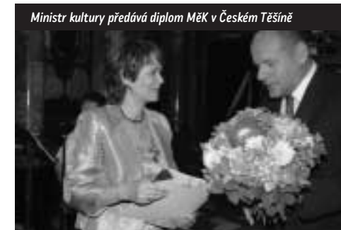
Ministr kultury předává diplom MĚK v Českém Těšíně