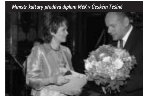
Ministr kultury předává diplom MĚK v Českém Těšíně