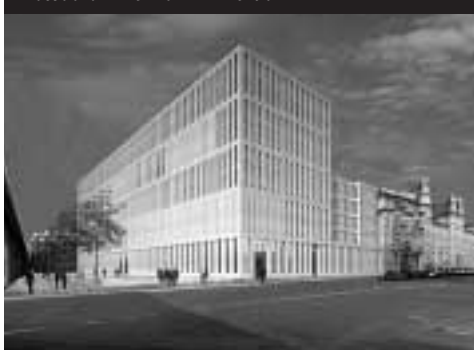
Sídlo Univerzitní knihovny Humboldtovy univerzity v Jacob und Wilhelm Grimm – Zentrum

Abych nebyl mylně pochopen, mé konstrukce nemají sloužit jako argument pro návrat ke starým, osvědčeným a krásným stavbám, abychom se vyvarovali nespolehlivosti hodnotících kritérií dnešní architektury. Mnohem více je naším úkolem nacházet „nové“ z naší doby a techniky vycházející formy a návrhy, které budou stejně tak krásné, jako trvalé. Existuje postup, podle kterého bychom mohli, jednotlivci či grémia, systematicky eliminovat rozdílné normy hodnocení, a poté dojít k uváženému rozhodnutí? Jaké normy a vlastnosti to jsou pro veřejnou stavbu, např. knihovnu? To, že pro architektky ztvárnění stavby a urbanizační aspekty mají a musejí mít prioritu, je