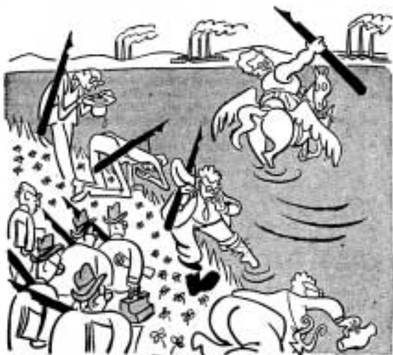
Mně se stále tlačí na nos to vyprodání o vojsku Gedeosů, z nichž někteří, kteří přišli k řece a měli žití, dlouho hledali oddoby, ze kterých by se mohli napít, jiní pili z příbít, jiní sobírali vodu jenom svou prsty, ale byli také takoví, kteří si klekli a pili rosnou z proudu. Jan Drda na čtení československých spisovatelů