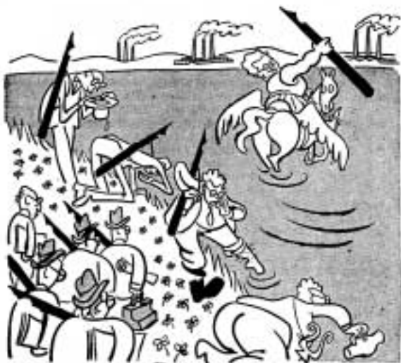
Mně se stále tlačí na nos to vyprodání o vojáku Gedeosovi, z nichž někteří, kteří přišli k řece a měli žití, dlouho hledali oddoby, ze kterých by se mohli napít, jiní pili z příbít, jiní sobírali vodu jenom svou prsty, ale byli také takoví, kteří si klekli a pili rovnou z proudu. Jan Drda na čtení československých spisovatelů