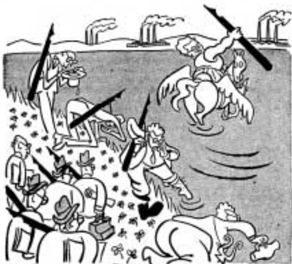
Mně se stále tlačí na mysl to vyprodání o vojsku Gedeosů, z nichž někteří, kteří přišli k řece a měli žití, dlouho hledali oddoby, ze kterých by se mohli napít, jiní pili z příbít, jiní sobírali vodu jenom svou prsty, ale byli také takoví, kteří si klekli a pili rovnou z proudu. Jan Drda na čtení československých spisovatelů