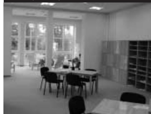
Čítárna s výhledem do parku