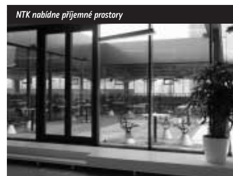
NTK nabídne příjemné prostory

Dnes se více než dřív uplatňuje v knihovnách i kolem nich zeleň. Vedle estetického a psychologického účinku mohou rostliny v knihovně ovlivňovat příznivě i klima, ale jejich hlavní role je v okolí budovy, ať jde třeba o veřejný park nebo zahradu