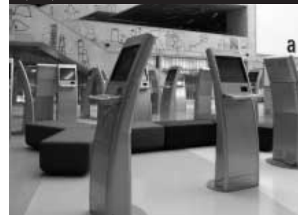
Infokiosky v Národní technické knihovně

výrazem, tak činností. Uživatel si tuto proměnu bezesporu uvědomuje; přibývají v nich studující a prodlužuje se i doba jejich pobytu.