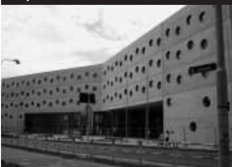
Studijní a vědecká knihovna v Hradci Králové

Ale Koolhaasově knihovně by asi slušel i název kultovní knihovna , protože jako se vůči Kaplického chobotnici vymezují čeští odborníci i občanská iniciativa Demokracie staví, k seattleské se vymezují i knihovničtí na celém světě. Na málokterém semináři ve světě chyběl většinou pochvalný referát o této knihovně, vždy s několika zajímavými fakty: knihovna stojí na tak exponovaném místě, že tu původní dala městská správa zbourat a na jejím místě postavit novou, knihovna má z obyvatel města (2 milióny) šedesát procent registrovaných čtenářů a výrazný informační kód (i když ten se každému líbit nemusí).