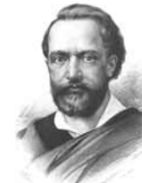
Karel Hynek Mácha

Pod staletým dozorem pyšného Radobýlu, na břehu řeky Labe, obklopeno zvlněným Středohořím, leží město Litoměřice, jehož historie sahá do daleké minulosti. Na náměstí, z něž se dá historická sláva královského města zřetelně číst z gotických, renesančních a barokních staveb, stojí i krásná secesní budova – litoměřická knihovna Karla Hynka Máchy.