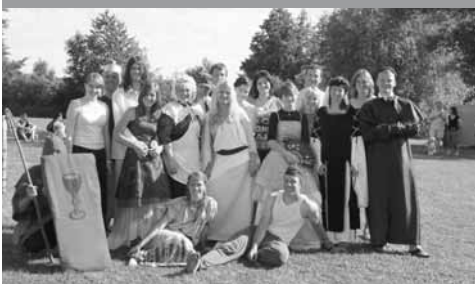
Skupina Čtyřlístek z dětského dne – Cesta do minulosti

Ale nejdůležitější je samozřejmě naše práce s lidmi. Knihovna již není jen místem výpůjček knih, je místem kulturního dění, komunitní centrum a i my jsme se chtěli aktivně do takové práce zapojit. Začali jsme vyhlašování literárních a výtvarných soutěží a postupně jsme si přidávali náročnější akce. V současné době pořádáme pravidelně Noc s Andersenem (letos byla již šestá) a starším čtenářkám, které stále chtějí tyto noci navštěvovat, připravujeme Noc s princeznami. Pasovali jsme již čtyři třídy „druháků“ na rytíře řádu čtenářského a moc se nám osvědčilo pasovat právě druháky, kteří hned začínají číst a spousta těchto malých čtenářů rozšíří trvale počet návštěvníků knihovny. Pro děti pořádáme i pěveckou soutěž, se kterou bychom se už ale do knihovny