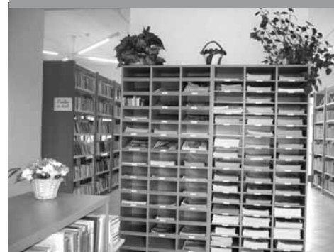
Pohled do interiéru

Od poloviny září 2010 si mohou tedy čtenáři i ostatní návštěvníci knihovny vybírat z více než 11 000 svazků, 25 titulů časopisů, využívat online katalog a veřejný internet. Velkou novinkou je krásný prosvětlený dvůr se čtenářskou terasou, která navazuje na knihovnu. Tyto prostory se v letošním roce rozrostou o altán, hrací prvky pro menší děti a lavičky.