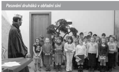
Pasování druháků v obřadní síni