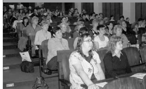
Účastníci letošní dílny

Sabelové. Neopomněla kromě jiného všechny přítomné pozvat do Ostravy na říjnový happening k zahájení Týdne knihoven .