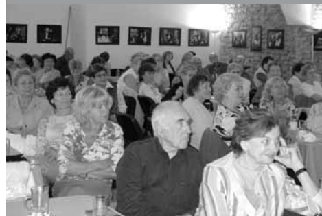
Posluchači univerzity 3. věku

nancovatelná. U nás by to bylo v případě, kdybychom měli k dispozici vlastní přednáškový sál s dostatečným počtem míst (nájem sálu dosahuje téměř 50 % nákladů z celkového rozpočtu). Školné u nás činí 200 Kč za semestr, zájezdy a další doprovodné akce se platí zvlášť.