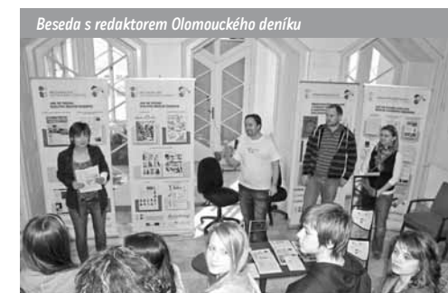
Beseda s redaktorem Olomouckého deníku

□ Pokud je tvorba časopisu na školách uskutečňována skutečně jako projekt, může se stát výborným nástrojem pro realizaci všech pilířů mediální výchovy a potažmo i rozvoje čtenářské gramotnosti. Pomáhá tříbit novinářský styl, rozpoznat prvky manipulace, nacházet hranice mezi virtuálním a reálným světem. Dává dostatečný prostor pro sebereflexi, pro zamýšlení se nad záměrem textu, pro rozvíjení dovednosti nalézt podstatné a pravdivé informace a pro schopnost s nimi dále účinně pracovat... U tvorby sborníku je to podobné. Od touhy psát je totiž jen krůček k otázce „jak na to?“. A to už jsme u hlubšího přemýšlení o textech a pozornějšího čtení, což jsou dva konkrétní cíle výuky čtenářské gramotnosti z mnoha. Nicméně podpora tvorby školních časopisů a sborníků není jediným bodem našeho projektu. Máme mnoho dalších aktivit, kterými směřujeme k rozvoji čtenářské gramotnosti.