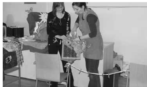
Semináře doprovázejí praktické ukázky

s dětmi o čtení a představovala jim zajímavé knihy. Díky tomu nejde o jednorázovou akci, ale o systematickou podporu čtenářství – a knížkám tak „unikne“ jen málokterý ze začínajících čtenářů. Oproti předchozím ročníkům nastala letos malá změna, která způsobila při psaní zpráv a hodnocení velké gramatické problémy se změnou „y“ a „i“ – ke královně knížek přibyl totiž i král. V průběhu června se prvňáčci účastnili slavnostního programu nazvaného Klíčování , kde obdrželi klíč od království knížek a další drobné odměny.