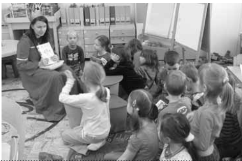
Šňůrka pro prvňáčka

německé autory píšící fantasy představil Libor Marchlík z nakladatelství Fantom Print. Ukázalo se, že i v současnosti existuje velké množství spisovatelů, kteří tvoří ve velkém a dokáží oslovovat mladé čtenáře. Nicméně do České republiky se dostává stále jen zlomek toho, co v Německu a Rakousku vychází.