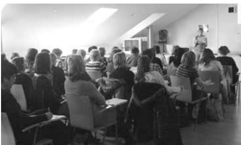
O semináře Centra je stále zájem

Druhý den byl věnován ukázkám besed a pořadů jednotlivých knihoven. Vyšlo najevo, že v knihovnách se dělají většinou souhrnné pořady o dobrodružné literatuře našich sousedů, jednotliví autoři jsou zastoupeni méně. Nejdělečným spisovatelem je pak zřejmě Karel May, který se v programu objevil hned dvakrát. Mluvil se i o rakouském spisovatelé Thomasi Brezinovi, který díky několika stovkám vydaných knížek patří mezi nejpłodnější dětské spisovatele vůbec.