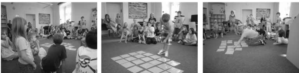
V Městské knihovně ve Slaném již lekce IV připravují, proč ale nebyť ještě lepší...