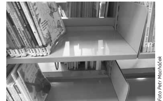
Zítřejší už mohou být jinde

Možnost půjčit si knihu z jiné pobočky v té, kterou mám nejlépe/nejlépe dostupné, by podle stejného průzkumu uvítalo 53 % čtenářů. Vzhledem k poměrně vysoké náročnosti na zabudování služby do systému (Koniáš, on-line katalog) se čtenářské přání splnilo až v březnu roku 2012, kdy byla spuštěna služba „rezervace s dovozem“. Směrem ke čtenáři je princip zcela jednoduchý – čtenář si při zadávání rezervace zahrne z výběru poboček tu, na které si chce titul půjčit, a je na knihovně, aby mu jeho přání splnila. Ať už svazkem, který je jinde přítomný ve volném výběru, nebo svazkem odhyceným při vracení. Rezervace s dovozem je placená služba, za každou splněnou rezervaci čtenář zaplatí 10 Kč.