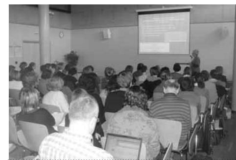
Zájem o seminář byl velký

Návrh, aby knihovníci představili databáze, které vytvářejí, formou prezentací, dostal zelenou. Seminář byl naplánován na duben 2012 s místem konání v SVK v Hradci Králové. Po zveřejnění výzvy v elektronické konferenci Knihovna jsem s napětím čekala, zda knihovníci – zpracovatelé databází zareagují, neboť uběhl celý dlouhý rok od jednání, kdy jsme o náplni semináře mluvili. Mé obavy se nepotvrdily. Během čtrnácti dnů byl program zcela zaplněn. Některé přednášející jsem musela odmítnout, což mi bylo opravdu líto. Proto jsem po konzultaci s kolegy navrhla, že (nejen) neuspokojení zájemci o prezentaci mohou zaslat popisy databází ke zveřejnění formou posteru. Jestliže prezentací na semináři odeznělo 18, pak posterů bylo vystaveno celkem 72. Na uváděných údajích jsme se předem dohodli a zájemce o poster obdržel příslušný tiskopis. Součástí popisu byla i citace. Samotný seminář lze charakterizovat jako pestrý kaleidoskop českých databází, od těch tvořených takřka na koleni pro úzkou skupinu uživatelů až po velice sofistikované, od skromně financovaných z vlastních zdrojů knihovny až po databáze podporované z grantů. Cílem semináře nebylo naučit účastníky v bázích vyhledávat,