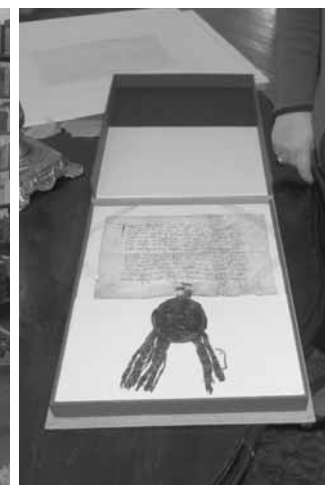
Pergamenový dokument z roku 1324 ze sbírky opolské knihovny