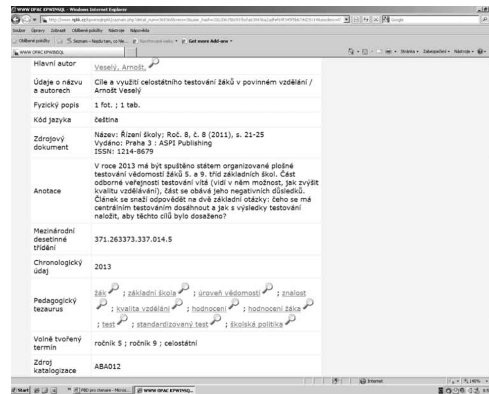
Obr. 1 Ukázka záznamu článku z PBD v on-line katalogu

Tezaurus se skládá z abecedního rejstříku a systematické části (tzv. stromu), v níž jsou deskriptory uspořádány podle tematické příbuznosti. V abecedním rejstříku je u každého deskriptoru uveden jeho anglický ekvivalent a u méně obvyklých výrazů i vysvětlující poznámka. Systematická část tezaurovi obsahuje 36 tematických oddílů, tzv. mikrotezaurů, a deskriptory v nich jsou vzájemně provázány různými typy vazeb (podřazenost a nadřazenost, asociace, ekvivalence apod.). Uživatel nebo rešeršér, který nezná přesný termín vyjadřující hledané téma, tak může z mikrotezaurů (věnovaných např. výuce, učení, školské politice, řízení a organizaci školství, obsahu výchovy a vzdělávání, poznávacímu procesu, osobnosti, demografickému, rodinnému či pracovnímu prostředí a řadě dalších oblastí) vybrat ten, který by mohl hledané téma obsahovat, a konkrétní deskriptor v něm dohledat. Protože je pedagogický tezaurus provázán s on-line katalogem, můžeme se z něho kliknutím na deskriptor