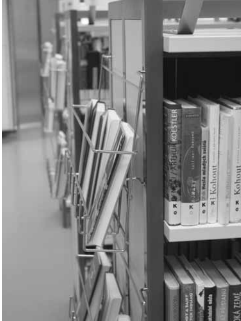
Jedna pobočka? Spíše jeden fond!

pem „všudevracení“ bylo toto strategické prohlášení v mnohém překonáno a v současné době je nutné chápat množinu fondů jednotlivých poboček MKP jako jeden celek, jako fond Městské knihovny v Praze.