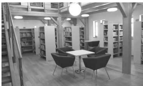
Oddělení pro děti

Autor projektu Ing. arch. Lubomír Dehner pojal přestavbu velkoryse – ke stávajícímu domku, ve kterém se nacházela kancelář a v patře půjčovna, připojil i stodolu, do té doby sloužící jako technické zázemí pro Obecní úřad v Holasovicích. Propojením obou budov vznikl nádherný členitý prostor, který beze zbytku naplnil naše knihovnická očekávání.