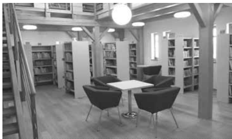
Oddělení pro děti