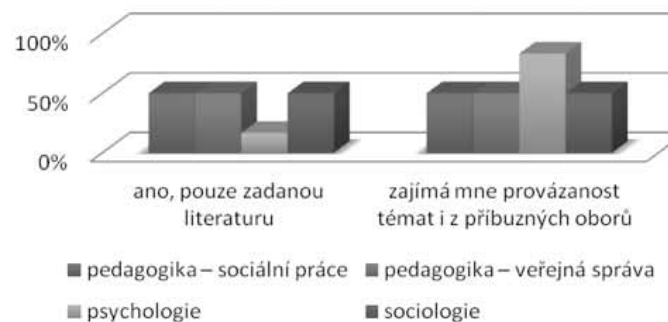
Graf 1: Preferujete čtení odborné literatury jen ze svého studijního oboru?

Další oblastí výzkumného zájmu se stal výběr typu média jako nástroje při vyhledávání důležitých informací v rámci oboru. Studenti se téměř shodně vyslovili jak pro knihy, tak pro