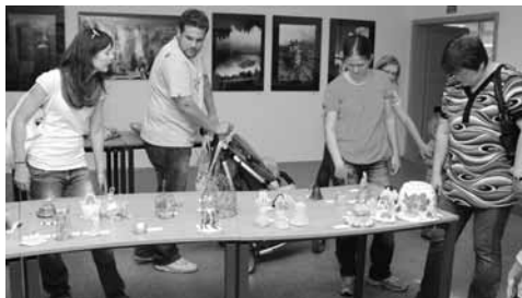
Výstava zvonků 2011

herna, kde se konají pestré odpolední aktivity pro mládež. V Litvínově totiž chybí centrum volného času pro děti a knihovna má ambici tuto službu částečně nahradit. Novinkou v herně je moderní technika, jako je hrací konzole, projektor, taneční podložka či wi-fi zóny. Zpracovávají se také čtyři noví pracovníci , kteří se dětem maximálně věnují.