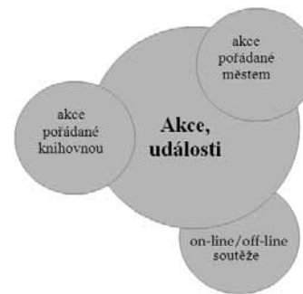
Obr. 6: Schéma struktury modulu Akce, události

Třetí část modelu představují Akce, události . Oblasti do ní zahrnuté znázorňuje obrázek 6 a sběr spočívá především ve sledování informačních kanálů jak uvnitř knihovny, tak také například informačního centra daného města a dalších webových stránek zabývajících se kumulací informací tohoto typu.