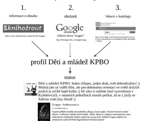
Obr. 2: Příklad příspěvku získaného harvestingem z různých informačních zdrojů

Na základě těchto informací pak lze udělat jednorázovou, v případě potřeby ale i vícenásobnou rešerši, vybrat a nashromáždit informační zdroje odpovídající zjištěným charakteristikám a ty pak sledovat, pravidelně kontrolovat a sbírat či vybírat