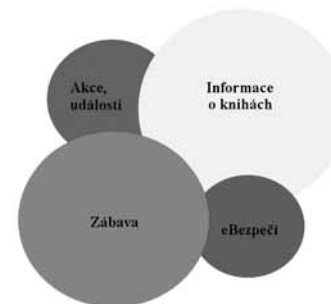
Obr. 3: Schéma struktury tematické náplně vzorového profilu Děti a mládež KPBO

Způsob naplňování profilu byl již osvětlen, jedna ze dvou směrodatných otázek – „Jak?“ – byla zodpovězena. Zbývá ještě najít odpověď na druhou otázku – „Co?“ – aneb struktura a složení vlastní náplně vzorového profilu. Po důkladném zamyšlení nad možnostmi a mezemi, kterými se OASS Facebook vyznačuje, byly stanoveny čtyři okruhy sdružující základní témata, o nichž lze z pohledu knihovny uvažovat jako o adekvátních. Tematickou strukturu hlavních okruhů ilustruje obrázek 3.