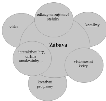
Obr. 5: Schéma struktury modulu Zábava

Způsob naplňování profilu a charakter obsahu tohoto modulu je do značné míry závislý na konkrétní osobě, která jej bude vykonávat. Je vhodné nebát se identifikovat, akceptovat a přizpůsobit nárokům, zájmům a požadavkům vykazovaných cílovou skupinou.