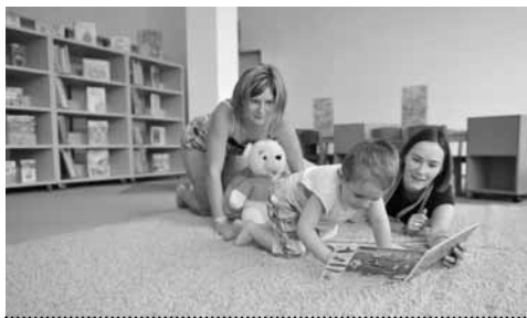
„Dětský ráj“ pro nejmenší čtenáře, oddělení pro děti a mládež Regionální knihovny Karviná

Regionální knihovna Karviná (dále jen RKK) usilovala o vybudování své ústřední knihovny bezmála 45 let. Díky podpoře našeho statutárního města byl záměr rekonstrukce knihovny zařazen do Integrovaného plánu rozvoje měst a byla podána žádost o dotaci z Regionálního operačního programu Moravskoslezského kraje v Ostravě. Smyslem projektu bylo vytvořit moderní městský vzdělávací, informační, komunitní a kreativní komplex s kvalitními službami a uživatelským komfortem.