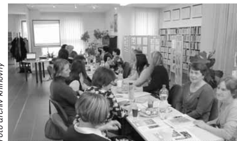
Podzimní setkání knihovníků v Březnici (2011)

Do dnešního dne se uskutečnila tři neformální setkání knihovníků . Po dohodě s Městskou knihovnou v Kralupech nad Vltavou, se Vzornou lidovou knihovnou Velké Popovice a Městskou knihovnou