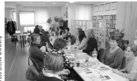
Podzimní setkání knihovníků v Březnici (2011)

Do dnešního dne se uskutečnila tři neformální setkání knihovníků . Po dohodě s Městskou knihovnou v Kralupech nad Vltavou, se Vzornou lidovou knihovnou Velké Popovice a Městskou knihovnou