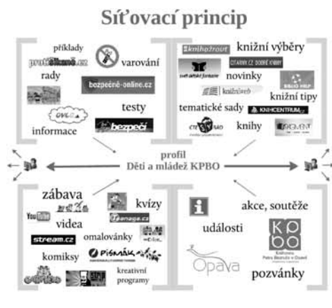
Obr. 1: Síťovací princip testovacího profilu Děti a mládež KPBO na FB

Obrázek 1 názorně ilustruje síťovací princip přímo na profilu Děti a mládež KPBO, který je předmětem praktické části této studie.