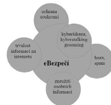
Obr. 7: Schéma struktury modulu eBezpečí

Na prezentaci výsledků tohoto hodnocení již v článku není místo, jsou však obsaženy v diplomové práci, jež se tímto průzkumem zabývala a je též zdrojovým dokumentem. Plný text je k dispozici i na internetu po zadání názvu práce do vyhledávače.