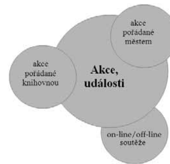
Obr. 6: Schéma struktury modulu Akce, události

Třetí část modelu představují Akce, události . Oblasti do ní zahrnuté znázorňuje obrázek 6 a sběr spočívá především ve sledování informačních kanálů jak uvnitř knihovny, tak také například informačního centra daného města a dalších webových stránek zabývajících se kumulací informací tohoto typu.