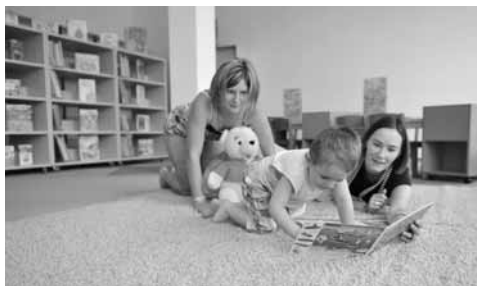
„Dětský ráj“ pro nejmenší čtenáře, oddělení pro děti a mládež Regionální knihovny Karviná

Regionální knihovna Karviná (dále jen RKK) usilovala o vybudování své ústřední knihovny bezmála 45 let. Díky podpoře našeho statutárního města byl záměr rekonstrukce knihovny zařazen do Integrovaného plánu rozvoje měst a byla podána žádost o dotaci z Regionálního operačního programu Moravskoslezského kraje v Ostravě. Smyslem projektu bylo vytvořit moderní městský vzdělávací, informační, komunitní a kreativní komplex s kvalitními službami a uživatelským komfortem.