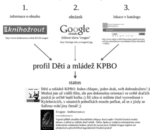
Obr. 2: Příklad příspěvku získaného harvestingem z různých informačních zdrojů

Na základě těchto informací pak lze udělat jednorázovou, v případě potřeby ale i vícenásobnou rešerši, vybrat a nashromáždit informační zdroje odpovídající zjištěným charakteristikám a ty pak sledovat, pravidelně kontrolovat a sbírat či vybírat