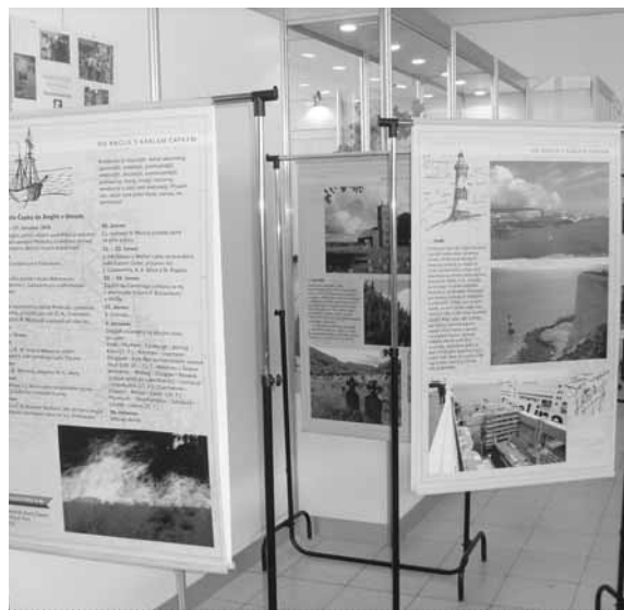
Výstava Do Anglie s Karlem Čapkem

Výstava Život a doba spisovatele Karla Čapka putuje po knihovnách již od roku 2009 a podle zájmu ještě minimálně letošní rok putovat bude. Výstava Do Anglie s Karlem Čapkem byla vytvo-