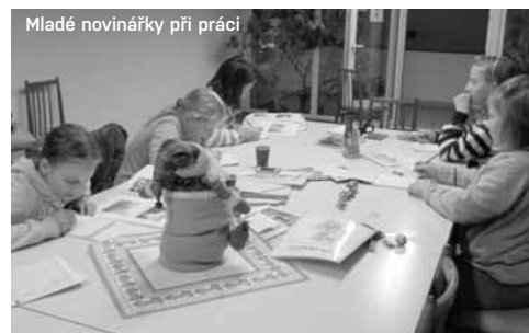
Mladé novinářky při práci

A co se nám za loňský rok povedlo? Jak děti kroužek vnímají a co jim přináší? Jako správní novináři vám o tom sami napsali několik postřehů.