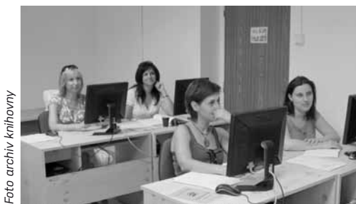
Kurz knihovnického minima (Kladno, květen 2011)

Díky nové koncepci mohlo krajské metodické oddělení Středočeské vědecké knihovny v Kladně nabízet od roku 2006 mnohem více vzdělávacích akcí než předtím. Také stále častější požadavky knihovníků na pořádání přednášek o české literatuře nás přiměly k zorganizování cyklu přednášek pod společným názvem Současné české literární dění , které byly již od počátku určené především pracovníkům knihoven ve službách a akvizitérům. Součástí cyklu byly tyto přednášky: Prolegomena k nejmladší poezii, Současná česká próza, Kritika a esejistika, Literární brak, Drama a literatura v médiích, Česká poezie a Nakladatelství a edice . Takový cyklus by se mohl periodicky opakovat po třech letech doplněný o nové poznatky.