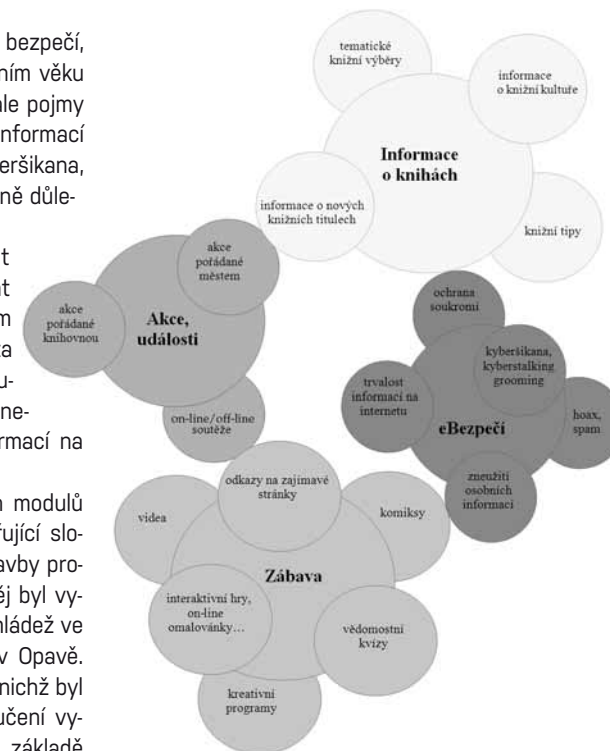
Obr. 8: Schéma podrobnější tematické struktury modelu profilu Děti a mládež KPBO