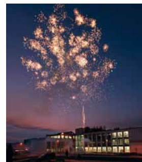
Slavnostní otevření zrekonstruované RKK 10. 11. 2011