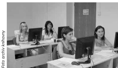
Kurz knihovnického minima (Kladno, květen 2011)

Díky nové koncepci mohlo krajské metodické oddělení Středočeské vědecké knihovny v Kladně nabízet od roku 2006 mnohem více vzdělávacích akcí než předtím. Také stále častější požadavky knihovníků na pořádání přednášek o české literatuře nás přiměly k zorganizování cyklu přednášek pod společným názvem Současné české literární dění , které byly již od počátku určené především pracovníkům knihoven ve službách a akvizitérům. Součástí cyklu byly tyto přednášky: Prolegomena k nejmladší poezii, Současná česká próza, Kritika a esejistika, Literární brak, Drama a literatura v médiích, Česká poezie a Nakladatelství a edice . Takový cyklus by se mohl periodicky opakovat po třech letech doplněný o nové poznatky.