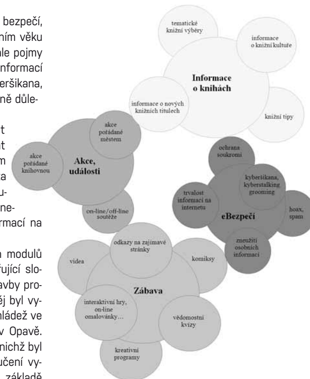
Obr. 8: Schéma podrobnější tematické struktury modelu profilu Děti a mládež KPBO