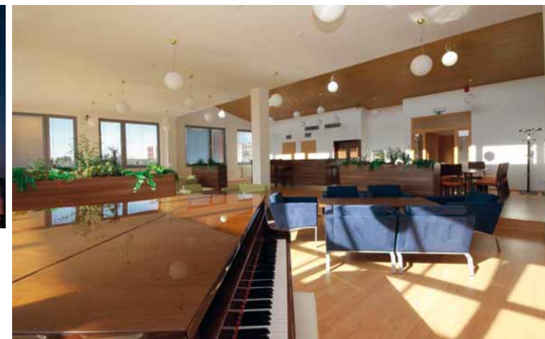
Literární salon sloužící k pořádání kulturních akcí, komorních koncertů, setkání s významnými osobnostmi a literárních večerů. Nabídka denního tisku a periodik, připojení k Wi-Fi, občerstvení