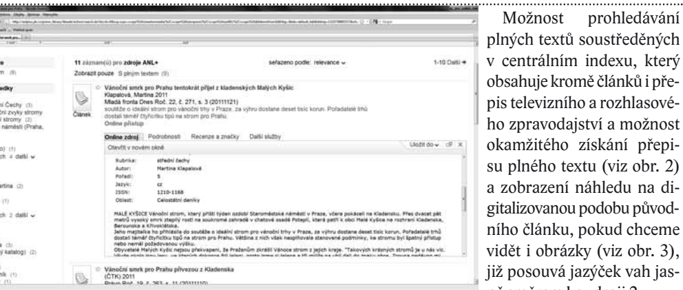
↑ Obr. 1: Zdroje 1 a 2 – porovnání metadat ↓ Obr. 2: Zdroj 2 – plný text

Možnost prohledávání plných textů soustředěných v centrálním indexu, který obsahuje kromě článků i přepis televizního a rozhlasového zpravodajství a možnost okamžitého získání přepisu plného textu (viz obr. 2) a zobrazení náhledu na digitalizovanou podobu původního článku, pokud chceme vidět i obrázky (viz obr. 3), již posouvá zájček vah jasně směrem ke zdroji 2.