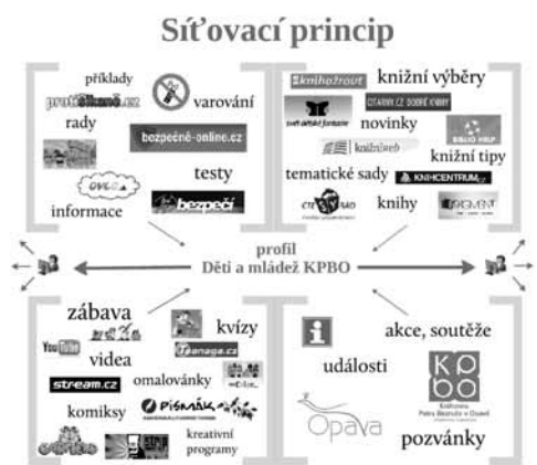
Obr. 1: Síťovací princip testovacího profilu Děti a mládež KPBO na FB

Obrázek 1 názorně ilustruje síťovací princip přímo na profilu Děti a mládež KPBO, který je předmětem praktické části této studie.