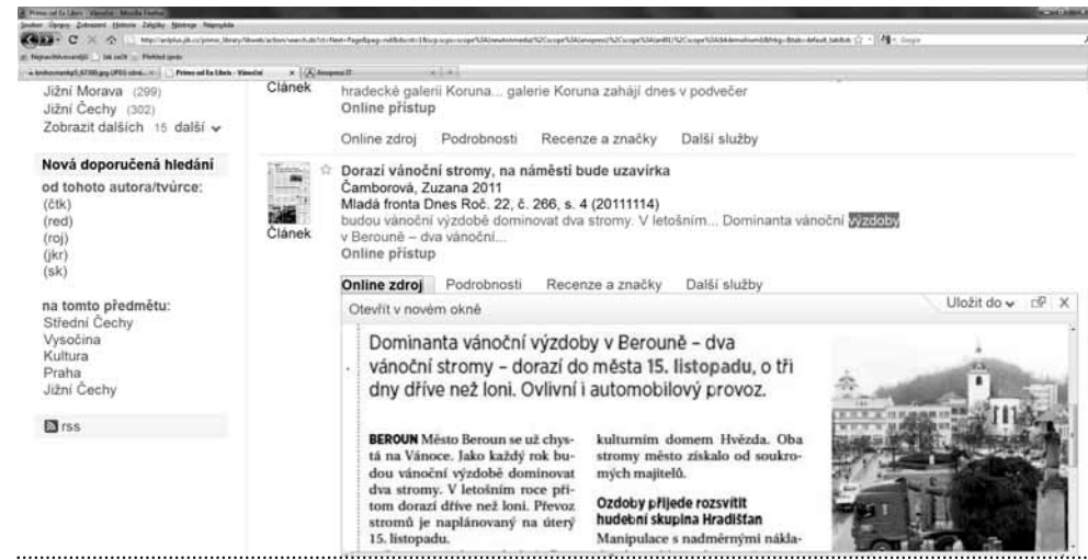
Obr. 3: Zdroj 2 – náhled na digitalizovanou podobu původního článku

Pokud porovnáme pouze metadata pocházející ze zdrojů 1 a 2 (viz obr. 1, nahoře zdroj 2, dole zdroj 1), nevychází porovnání pro zdroj 2 příliš lichotivě.