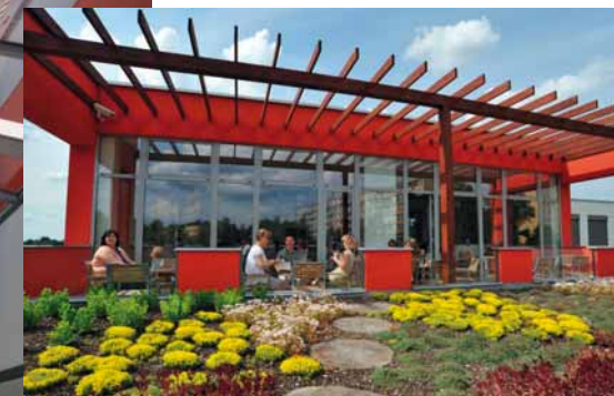
Terasa literárního salonu Regionální knihovny Karviná se zahrádkou sloužící k relaxaci četbou, s možností občerstvení