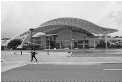
Konferenční centrum v San Juanu