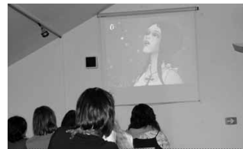
Seminář Literatura pro děti a mládež ve filmu, ukázka z básně Svatební košile

Součástí činnosti Centra je také prezentace aktivit SKIP KDK studentům některých kateder Pedagogické a Filozofické fakulty Masarykovy univerzity. Ti mají také možnost absolvovat v knihovně předmět Práce s dětským čtenářem , v rámci kterého připravují a realizují besedu s žáky. Mají tak příležitost seznámit se blíže s nabídkou knihovny a jejím prostředím. Díky zpětným vazbám, které jim pracovníci Centra i samotní pedagogové zvolených škol poskytují, si sami uvědomují, jak jim knihovny mohou být nápomocné v jejich pedagogické praxi.