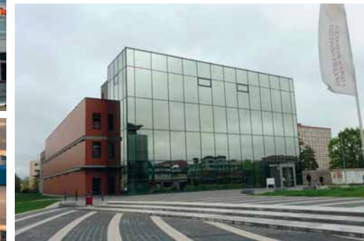
Akademická knihovna Jihočeské univerzity v České Budějovicích