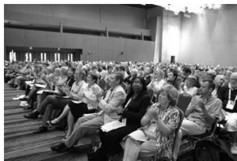
Zasedací sál Konferenčního centra

Konference pokračovala přednáškami na téma analýza informačních potřeb zákonodárců a zdokonalování parlamentních knihovnických služeb kolegyň a kolegů z Chile, Japonska, Nigérie, Číny (pro zajímavost – parlamentní knihovna zde neexistuje, ale z 1400 pracovníků Národní knihovny je pro služby Všečínskému lidovému shromáždění vyčleněno 60 lidí) a Velké Británie.