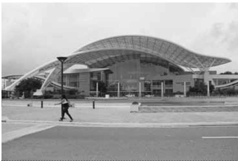
Konferenční centrum v San Juanu