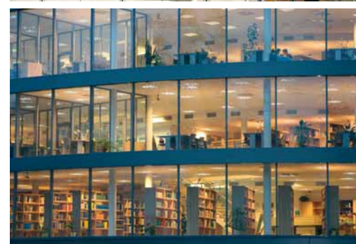
Knihovnické a informační centrum FM VŠE v Jindřichově Hradci