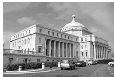
Kapitol – sídlo parlamentu

niční politikou. Většina Portorikánců je, zdá se, s tímto stavem spokojena, protože zastánci samostatnosti v občas konaných referendech svoji věc opakovaně prohrávají. V rozhovorech vystavují na odív a jsou hrdí, jak říkají, na svou indiánsko-afričskou duši, španělského ducha a americké tělo. Zkrátka netají se tím, že v současnosti převažují výhody (zejména ekonomické) jejich spojení s USA nad nevýhodami (například účast v armádě) z toho plynoucími. Řekněte například, komu z nás by se také nelíbilo tankovat 95 oktanový benzin 1 galon (necelé čtyři litry) za pouhých 96 centů (necelých 19 Kč)? Tento vliv USA se samozřejmě také odráží ve vyspělé organizaci, vybavení a funkcionalitě portorického knihovnictví, které je na světové úrovni.