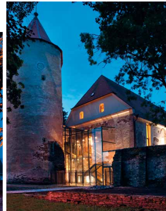
Městská knihovna Soběslav