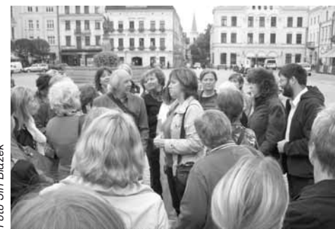
Účastníci odborné exkurze do historických knihoven v Těšíně (Polsko)