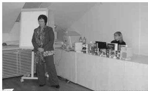
Seminář Literatura pro děti a mládež ve filmu, beseda Deník Anny Frankové

V roce 2011 přivítala knihovna pracovníky Bibliotéky Raczyńskich z Poznań, kteří představili aktivity své knihovny směrem k dětem, mládeži i celým rodinám. V rámci programu bylo možné zhlédnout vizualizaci nové budovy, která se pro knihovnu chystá, a zaměřit se na trendy, jež budou při rekonstrukci stávající budovy důležité – fondy a služby. Bylo velmi zajímavé seznámit se s fungováním knihovny a podmínkami, ve kterých celá nabídka vzniká a probíhá.