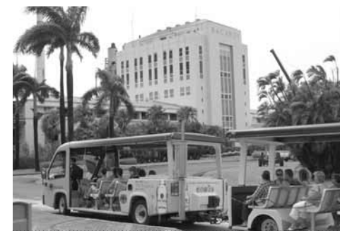
Knihovnická cestou za Bacardi

Sekce parlamentních knihoven IFLA uspořádala během hlavní konference půldenní seminář o inovativních přístupech při poskytování informačních produktů a služeb parlamentům a občanům s aktivní účastí parlamentních knihovníků z Kanady, Brazílie, Zimbabwe, Chile, USA a Iránu. Následoval celodenní seminář o aktuálně řešených úkolech a problémech parlamentních informačních služeb, jako jsou rozpočtové škrty v době hospodářské recese, úvodní informační kurzy pro nově zvolené zákonodárce, vyhodnocování odpovědí na referenční a analytické dotazy nebo zprostředkování historie a současnosti parlamentarismu široké veřejnosti. Zde se dostalo veliké pozornosti informaci o společném mezinárodním projektu pěti středoevropských zemí Višegrád-