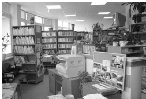
Interiér knihovny v Protivanově (Knihovna roku 2009)

12 posluchačů a výuku zajišťují odborníci z Vědecké knihovny v Olomouci a z Knihovny města Olomouce, odborným garantem je doc. Milada Písková ze Slezské univerzity v Opavě. Zatím se vždy kurz obsadil, ale v posledních letech lze upozorovat snižující se zájem. Doba, než se kurz naplní, bývá delší. Slábnoucí zájem je také vidět o kurzy počítačové gramotnosti. Zato přednášky týkající se práce se čtenáři a o literatuře se těší velkému zájmu knihovníků z celého kraje.