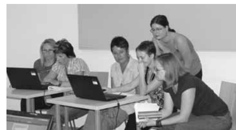
Knihovny a mediální svět – workshop nástroje.knihovna.cz

Poslední seminář roku 2011 proběhl v říjnu a věnoval se problematice literatury pro děti a mládež ve filmu. Tedy otázkám, zda-li je čtenářství ohroženo prostředky masové komunikace, nebo mohou-li tyto prostředky čtenářství naopak pomoci. Cílem nebylo odpovědět na tuto otázku, ale nechat každého posluchače, aby si odpověděl sám. Příspěvky byly zaměřené na téma filmové adaptace českých pohádek