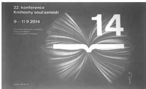
Vizuální styl konference