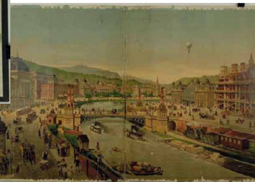
↑ Školní obraz Ve městě firma Eduard Hölzel, Vídeň-Olomouc, konec 19. stol.