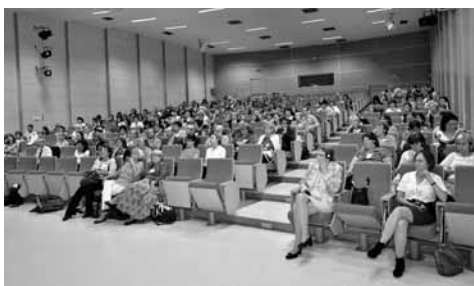
Účastníci v aule