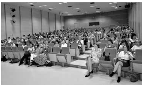
Účastníci v aule