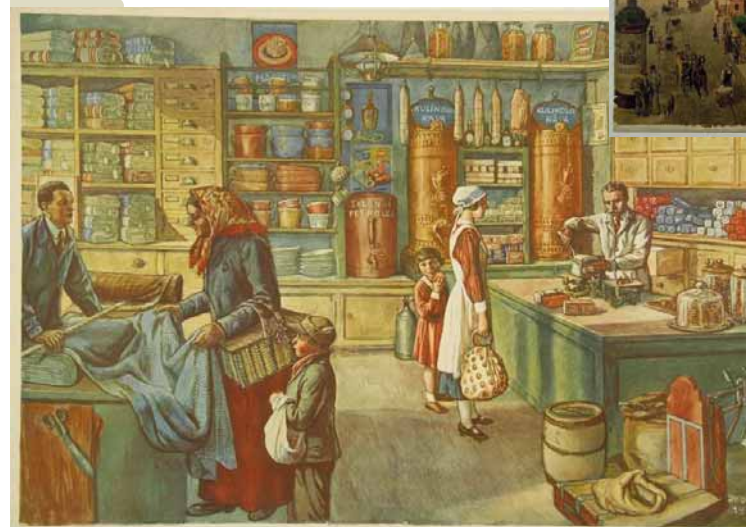
← Josef Kočí: Kupecký krám, Čsl. prvouka a vlastivěda v obrazech, list č. 51, Ústřední nakladatelství učitelstva československého, Praha-Brno-Banská Bystrica 1931