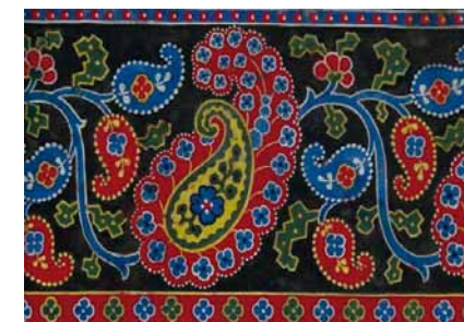
↑ Obrázek ze sbírky textilních vzorníků z Vlastivědného muzea a galerie v České Lípě