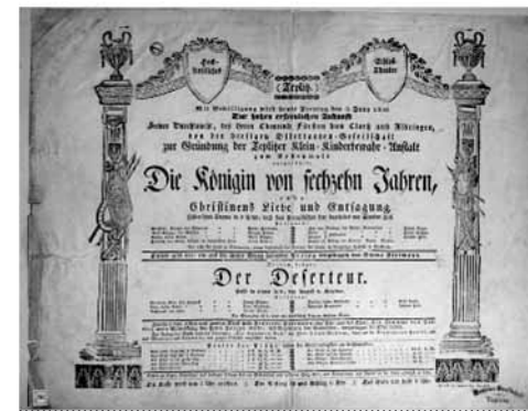
Obrázek divadelní cedule z Regionálního muzea v Teplicích

Veřejnost právem předpokládá, že ve sbírkách muzejních knihoven je mnoho zajímavých knih a dokumentů. Jsou to rukopisy, staré tisky, kramářské tisky, bibliofilie, sbírky uměleckých knižních vazeb minulosti i současnosti. Bývají