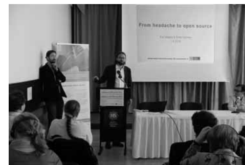
Finští kolegové hovoří o portálu Finna

Národní finský portál Finna ( www.finna.fi ) byl vybudován na základě potřeby jednotného vy-