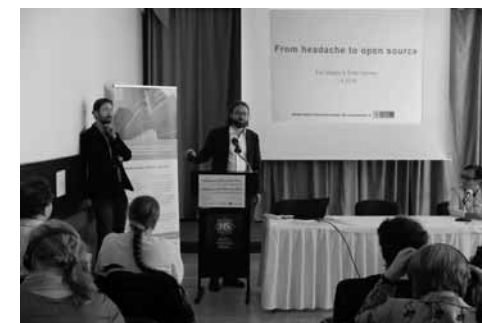
Finští kolegové hovoří o portálu Finna

Národní finský portál Finna ( www.finna.fi ) byl vybudován na základě potřeby jednotného vy-