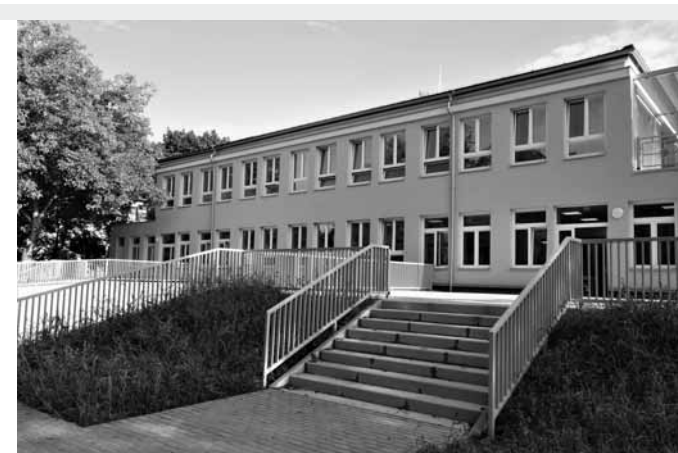
Nová terasa je větší, světlejší, a hlavně bezpečná

Budova bývalých jeslí patří městu, a proto i její rekonstrukce spadala plně do gesce města, a to od přípravy projektové dokumentace přes výběr zhotovitele až po realizaci stavby. Část, kde bývaly jesle, nově dostalo do užívání sociální zařízení města – SANTÉ, centrum ambulantních a pobytových služeb, které sem přesunulo denní stacionář pro osoby ve věku 15–64 let s mentálním, případně kombinovaným postižením. Kapacita stacionáře je plánovaná pro 25–30 osob, z toho maximálně deset s omezenou schopností pohybu. Součástí stavby byla přístavba vstupu s evakuačním výtahem a u objektu vzniklo parkoviště s vyhrazenými šesti bezbariérovými