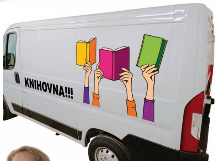
Polep knihovnické dodávky