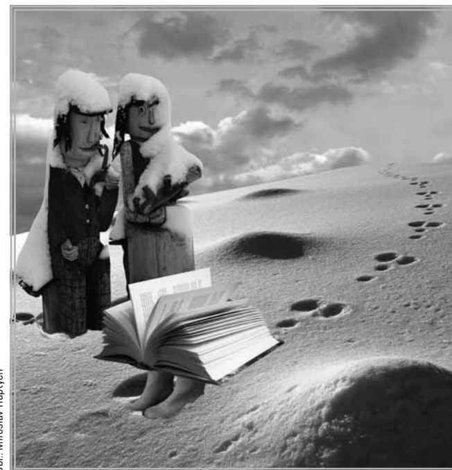
Obr.: Miroslav Hupčych

KRÁSNÉ VÁNOČNÍ SVÁTKY, MNOHO ZDRAVÍ A ÚSPĚŠNÝ NOVÝ ROK 2024 BEZ VÁLEČNÉHO ŘINČENÍ ZBRANÍ VE SVĚTĚ VÁM PŘEJÍ