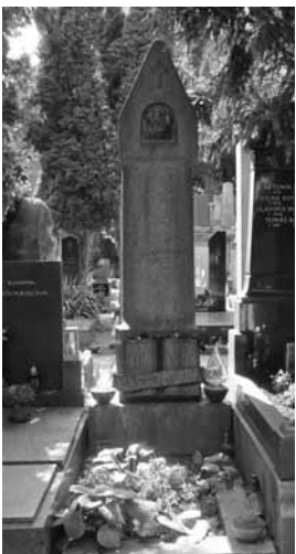
Současná podoba hrobu K. Čapka, kde je spolu s ním pohřbena i jeho žena Olga Scheinpflugová

menů nejrůznějších tvarů, jezer a moří – moře studeného a šedého, fjordů a přístavů, rybářů a námořníků. Švédskému pralesu věnoval nejen četné zkratkovité kresby, ale i samostatnou báseň. Výstižná je pak kapitola Švédský hvozď: ... severní les má do sebe ještě něco jiného, něco pravěkého a původního jako geologický útvar. Člověk by řekl, že jak to tu stojí a leží, vychrllila to v jednom geologickém okamžiku příroda, tak jako vychrllila žulu nebo nastlala křídou; a teď si, člověče, lámej kamínky nebo kácej dřívka! ... Řekne se les; stojí na milionech pňů, ale je to jedna stěna, jedna hladina, jedna předlouhá zelená vlna valící se od polárního kruhu na tisíc kilometrů sem k jihu: jako by tam nahoře, na Severu! na Severu! byl bezedný tryskající pramen nesmrtelného života a řinul se dunícemi peřejemi lesů, vodopádů lesů, slapy a proudy lesů, rozlitými hladinami a tichými rameny lesů pořád dolů, na Jih, na Jih!... 4