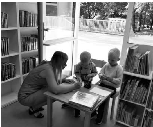
Momentka z oddělení pro děti, které je dobře prosvětlené

Rekonstrukce objektu bývalých jeslí byla kompletní – bez nadsázky lze říct, že původní zůstaly pouze nosné zdi. Jsou zde nové podlahy, střecha, okna, zateplení, veškeré rozvody, topení, sanitární zařízení a veškerý nábytek.