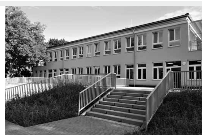
Nová terasa je větší, světlejší, a hlavně bezpečná

Budova bývalých jeslí patří městu, a proto i její rekonstrukce spadala plně do gesce města, a to od přípravy projektové dokumentace přes výběr zhotovitele až po realizaci stavby. Část, kde bývaly jesle, nově dostalo do užívání sociální zařízení města – SANTÉ, centrum ambulantních a pobytových služeb, které sem přesunulo denní stacionář pro osoby ve věku 15–64 let s mentálním, případně kombinovaným postižením. Kapacita stacionáře je plánovaná pro 25–30 osob, z toho maximálně deset s omezenou schopností pohybu. Součástí stavby byla přístavba vstupu s evakuačním výtahem a u objektu vzniklo parkoviště s vyhrazenými šesti bezbariérovými