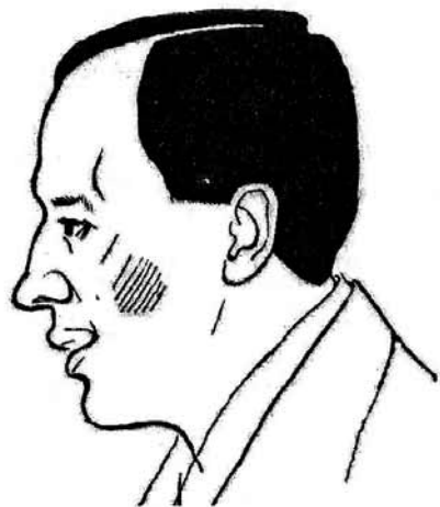
Kresba: Jirí Škopek

K. Čapek byl v jedné osobě též horlivým a poučeným botanikem (herbáře), pěstitelem alpínek, praktikujícím zahrádkářem, kynologem, milovníkem psů. Jeho pejsci Minda, Dášeňka, Iris, Blacke,