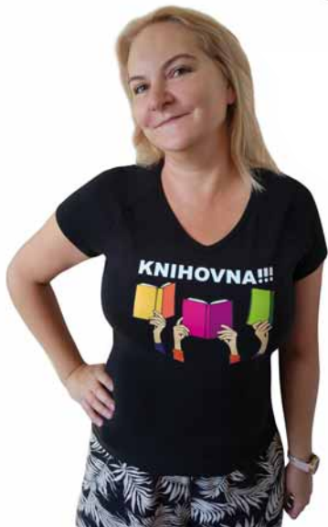
Potisk na reklamním tričku