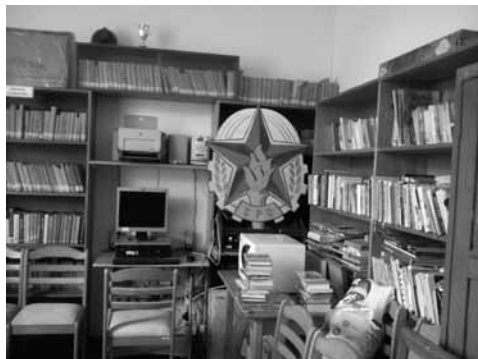
Pohled do interiéru knihovny ve Skřivani

Z nostalgie vás určitě dostane ta dračice za kopcem. To je ženská, panečku! Hotová Plajznerka. Papulu má, že jí do ní skočíte, jen když jí má k nádechu, šermuje rukama jako dirigent při marši, přeříká ediční plány i pozpátku, charakteristiku autorů, dokonce i knihovnické normy a doporučení má v malíku. Dlužno dodat, že většinou k tomu, aby na ně kašlala, aby šla svou cestou