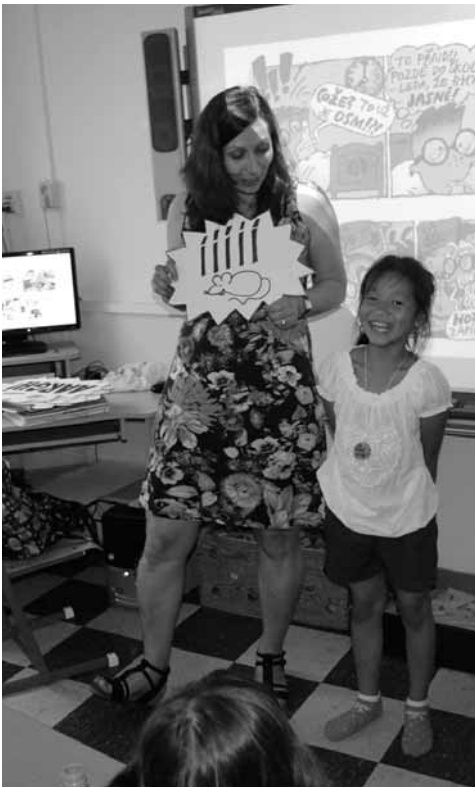
Z komiksově dílny, která se konala ve čtenářském klubu na ZŠ Engel v Brně

nejen soudobou produkcí, ale též historií komiksu a osvětlovat strukturu a jednotlivé prvky komiksového vyprávění.