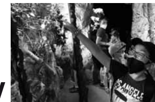
Letos děti navštívily i zoo v Děčíně