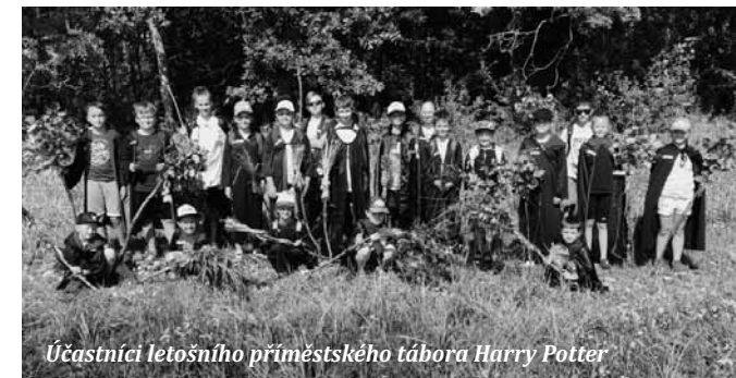
Účastníci letošního příměstského tábora Harry Potter

S příchodem jara jsme začali s realizací venkovních aktivit. Uspořádali jsme Velikonoční šifru , Kamínkovou pátračku a Knižní pátračku , jež se setkaly s velmi kladným přijetím širokou