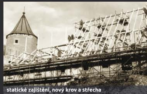
statické zajištění, nový krov a střecha