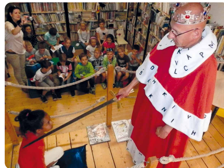
Příjemné prostředí dětského oddělení knihovny v Uherském Hradišti láká ke čtení i kluky ↓