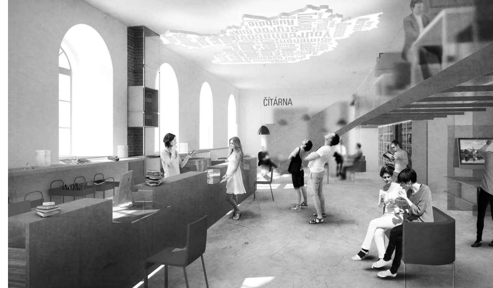
Vizualizace: město Písek

zvolených kritérií: velikosti prostoru, nákladů na stavbu, nákladů na provoz, naplnění cílů knihovny a v neposlední řadě také přijetí jednotlivých variant veřejností. Rada města dále rozhodovala o vypsání architektonické soutěže, schvalovala její výsledky a vybírala zhotovitele projektové dokumentace. Do kompetence rady patří rovněž rozhodnutí o vypsání a zadání výběrového řízení a následně schválení zhotovitele stavby. V případě financování stavby prostřednictvím dotací je v kompetenci rady města také výběr administrátora dotační žádosti. V procesu rozhodování se významně uplatňuje i vliv politického vedení města, jež hraje zásadní roli při prosazování záměru a rozhodování v kolektivních orgánech městské samosprávy.