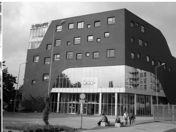
Nejnovější pobočka Městské knihovny ve Vratislavi, tzv. Grafít Library