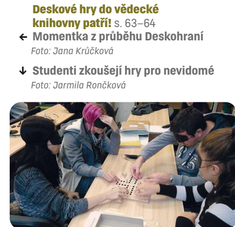
Deskové hry do vědecké knihovny patří! s. 63–64 ← Momentka z průběhu Deskohraní ↓ Studenti zkoušejí hry pro nevidomé