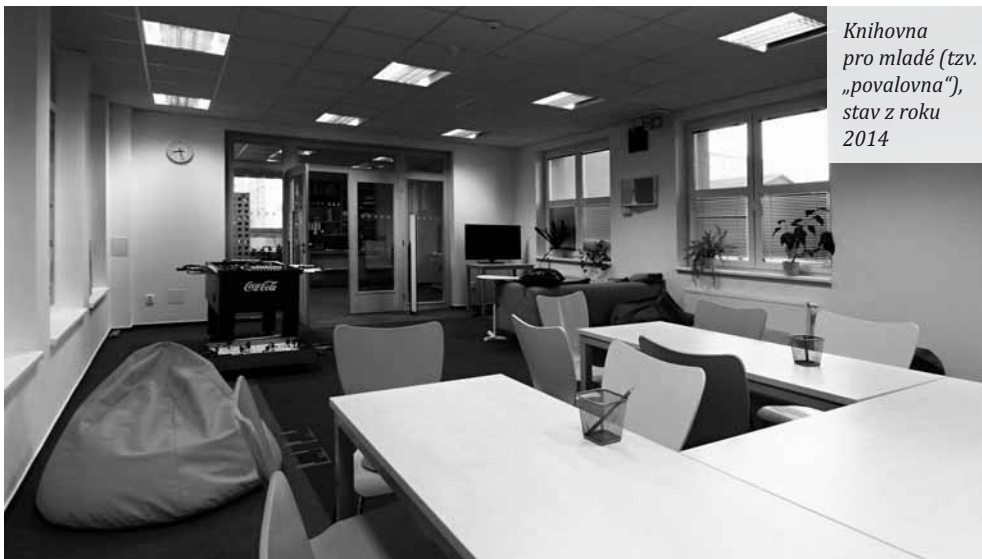
Knihovna pro mladé (tzv. „povařovna“), stav z roku 2014

a postupem času o celkové rozšíření knihovny a vytvoření důstojnějších podmínek. Bohužel, kromě tehdejší paní místostarostky, která za knihovnu bojovala jako lev, téměř nikdo z rady nepřišel, aby se podíval, jaký je skutečný stav. Rozhodovalo se od stolu v úřadu, odkud situace v knihovně nikterak závažně nepůsobila.