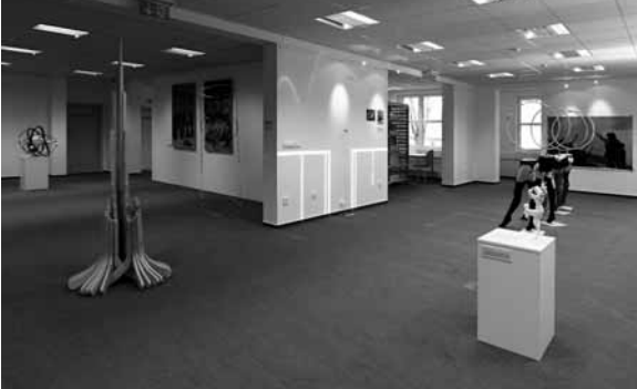
Galerie města Třince – výstavní prostor v knihovně; záběr z první výstavy Chléb a hry v roce 2014

Stavba se během realizace potýkala s několika neočekávanými problémy, které představovaly nestabilní podloží nebo vzlínající voda. Oproti původnímu projektu však nedošlo k žádným změnám a konečná stavba vypadá ve skutečnosti přesně podle plánů. Jinými slovy – po sedmi letech se zhmotnila budova, kterou jsme po celou dobu znali jen podle vizualizace z titulní