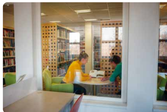
Café Čítárna – literární kavárna s čítárnou →

Vstupní hala s infocentrem, vlevo vstup do knihovny pro děti, před ním vodní prvek „Zeměkoule“, což ředitelku knihovny opravňuje k tomu, aby se titulovala „ředitelkou zeměkoule“ ↓