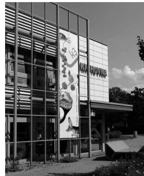
Pohled na hlavní vstup do budovy v roce 2018

A co víc. V roce 2004 začala knihovna provozovat městské informační centrum, které našlo útočiště v budově městského kina. V roce 2010 vzniklo v uvolněných komerčních prostorách jedinečné oddělení, přesněji celá unikátní knihovna pro mladá. V roce 2012 se pak knihovna stala provozovatelem městské galerie současného umění s výstavním prostorem v nedalekém kulturním domě. Postupně tak vznikl trojístelek slu-