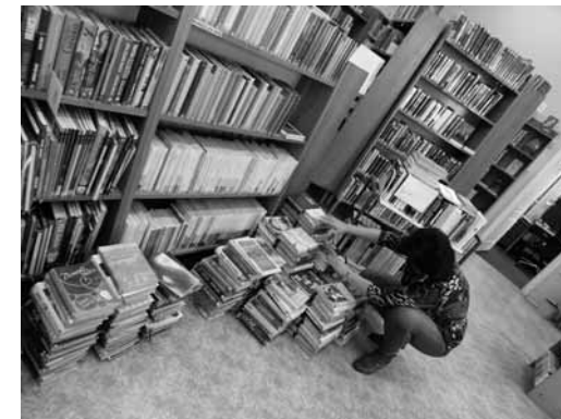
Pandemii koronaviru umožněná revize fondu... a roušky z produkce slánských knihovnic (dolní foto)

Psát o tom, co dělá slánská Knihovna Václava Štecha během řádění koronaviru, by bylo nudné. Děláme to, co většina knihoven. To, na co během roku není tolik času, prostoru a upřímně – možná ani chuti.