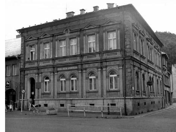
Budova spořitelny v Nejdku na náměstí Karla IV., kde sídlila městská knihovna až do roku 1992; po dvojím přestěhování je opět jejím sídlem (foto z roku 1988)

Městská knihovna Loket byla založena 29. 10. 1920, Obecní knihovna Citice v červenci 1921, Obecní knihovna v Krásnu také v roce 1921, Obecní knihovna Staré Sedlo udává únor 1923. U Obecní knihovny Dolní Nivy je uveden rok 1920. Obecní knihovna v Jindřichovicích byla založena 20. 12. 1927, ale otevřena byla až 15. 1. 1928.