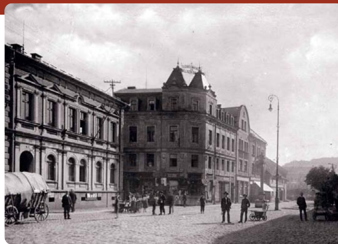
První knihovní zákon – 100 let: Karlovarský kraj s. 67–73

← Budova spořitelny v Nejdku (objekt vlevo vpředu), kde ve 30. letech sídlila německá městská knihovna; česká vznikla teprve na podzim 1945