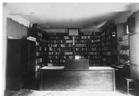
Interiér Obecní knihovny v Chodově v roce 1934

V roce 1912 se knihovna přestěhovala do velkého kabinetu měšťanské školy (dodnes existující místnost v přízemí školní budovy). Velký zájem o půjčování knih se projevil během první světové války, kdy byly zakázány taneční zábavy a koncerty a mnoho obyvatel města tak našlo zábavu v četbě. Knihovna fungovala bez podpory obce, jen z příspěvků členů a rozličných dárců. Od svého založení do roku 1926 vypůjčila půl milionu svazků, nejvíce v roce 1919, kdy si chodovští čtenáři půjčili více než 14 000 knih. V roce 1926 bylo také podle městské kroniky v majetku knihovny celkem 4394 knih, především beletrie a populárně naučné tituly.