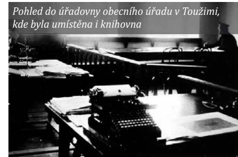
Pohled do úřadovny obecního úřadu v Toužimi, kde byla umístěna i knihovna

Celkové příjmy knihovny činily v roce 1910 192 rakousko-uherských korun (K), z toho 65 K získala knihovna od spolků, společenstev a podobných organizací, a 127 K z poplatků za využívání a ze zápisného (vč. dobrovolných poplatků a pokut). Výdaje činily celkem 203 K, z toho 120 K bylo vydáno na zakoupení knih a na předplatné časo-