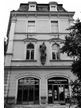
Současné sídlo Městské knihovny Karlovy Vary

Hlavním úkolem a cílem obecní lidové knihovny bylo uspokojování čtenářských potřeb nejšir-