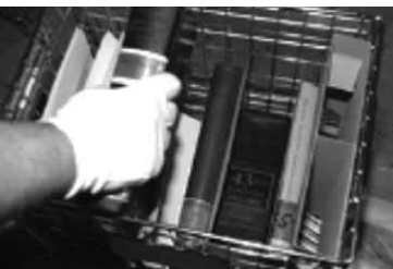
Umístění knih do speciálních košů před vložením do technologie odkyselování Papersave Swiss

V letech 2016–2019 bylo díky finanční podpoře Ministerstva kultury v rámci grantového programu Veřejné informační služby knihoven (VISK) , konkrétně VISK 7, celkem odkyseleno několik tisíc knih. Průměrná hodnota pH povrchu před odkyselením knih se pohybovala okolo 3,5–4 a po odkyselení se dostala na hodnoty okolo 7,5–8, což je hodnota, při které je papír a jeho chemická struktura nejstabilnější. V roce 2019 jsme začali poprvé odkyselovat knihovní fondy ve větším množství díky zvýšené ministerské dotaci ve výši šesti milionů korun.