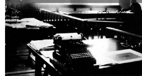
Pohled do úřadovny obecního úřadu v Toužimi, kde byla umístěna i knihovna

Celkové příjmy knihovny činily v roce 1910 192 rakousko-uherských korun (K), z toho 65 K získala knihovna od spolků, společenstev a podobných organizací, a 127 K z poplatků za využívání a ze zápisného (vč. dobrovolných poplatků a pokut). Výdaje činily celkem 203 K, z toho 120 K bylo vydáno na zakoupení knih a na předplatné časo-