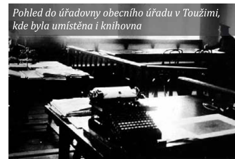
Pohled do úřadovny obecního úřadu v Toužimi, kde byla umístěna i knihovna

Celkové příjmy knihovny činily v roce 1910 192 rakousko-uherských korun (K), z toho 65 K získala knihovna od spolků, společenstev a podobných organizací, a 127 K z poplatků za využívání a ze zápisného (vč. dobrovolných poplatků a pokut). Výdaje činily celkem 203 K, z toho 120 K bylo vydáno na zakoupení knih a na předplatné časo-