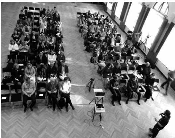
Momentka z konference o roli knihoven v průmyslu 4.0, která proběhla v říjnu 2019 ve Slaném

logické následky. To bude rovněž platit pro mnoho dalších lidí, kteří si práci udrží, ale prestiž jejich postavení výrazně poklesne.