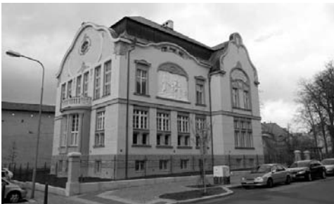
Budova MěK v Chebu po rekonstrukci z let 2012–2014