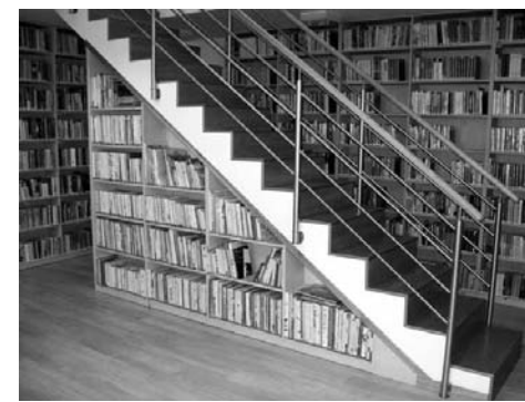
Prostory knihovny v Moutnici v nové víceúčelové budově obecního úřadu

Ve fondu knihovny se nachází více než 5000 knižních svazků, rozdělených do následujících kategorií: krásná literatura pro dospělé, naučná literatura pro dospělé, krásná literatura pro děti a mládež a naučná literatura pro děti a mládež. Literatura pro děti a mládež a komiksy mají v prostoru knihovny své zvláštní místo. Mimo tyto kategorie můžete v moutnické knihovně nalézt také tzv. sdílenou knihovnu, kde se nachází vyřazené knihy a neevidované knižní dary. Čtenáři si je mohou libovolně odnášet domů, vrátet