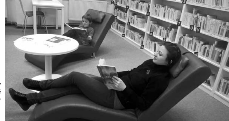
Do půjčovny pro dospělé zavítají i děti