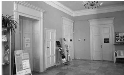
Pohled do interiéru v MěK v Chebu