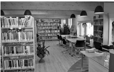
Moderní interiér MĚK v Březové