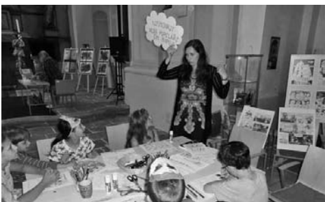
Z průběhu komiksového OstroFconu