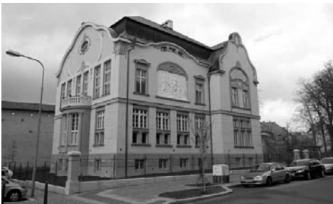
Budova MěK v Chebu po rekonstrukci z let 2012–2014