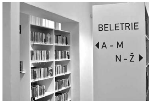
Pohled do čítárny

„Putování“ městské knihovny na mapě Rýmařova má ještě jednu, lehce bizarní linku: všechna její dosavadní sídla totiž sloužila mimo jiné k výkonu represivní moci. Na radnici se v minulých stoletích též vedly výslechy a ve sklepení se pa-