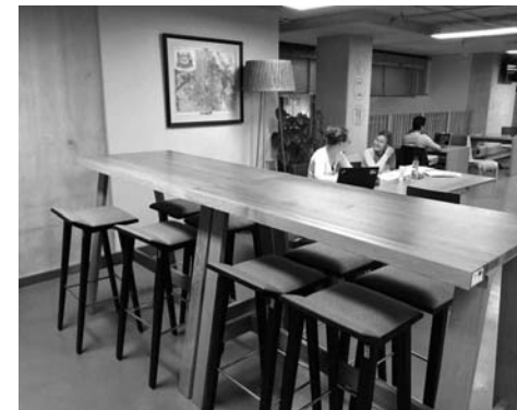
V knihovně jako v obýváku – propojení knihovny a kavárny v knihovně Lotyšské univerzity