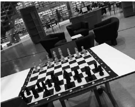
Šachový stůl v knihovně pro studenty Technické univerzity v Delftech, Nizozemsko

orientované na lidi, zároveň je tato práce větší- nou neviditelná, vůbec ne oslnivá, přitom je ale extrémně důležitá. A je třeba si jí vážít. 10