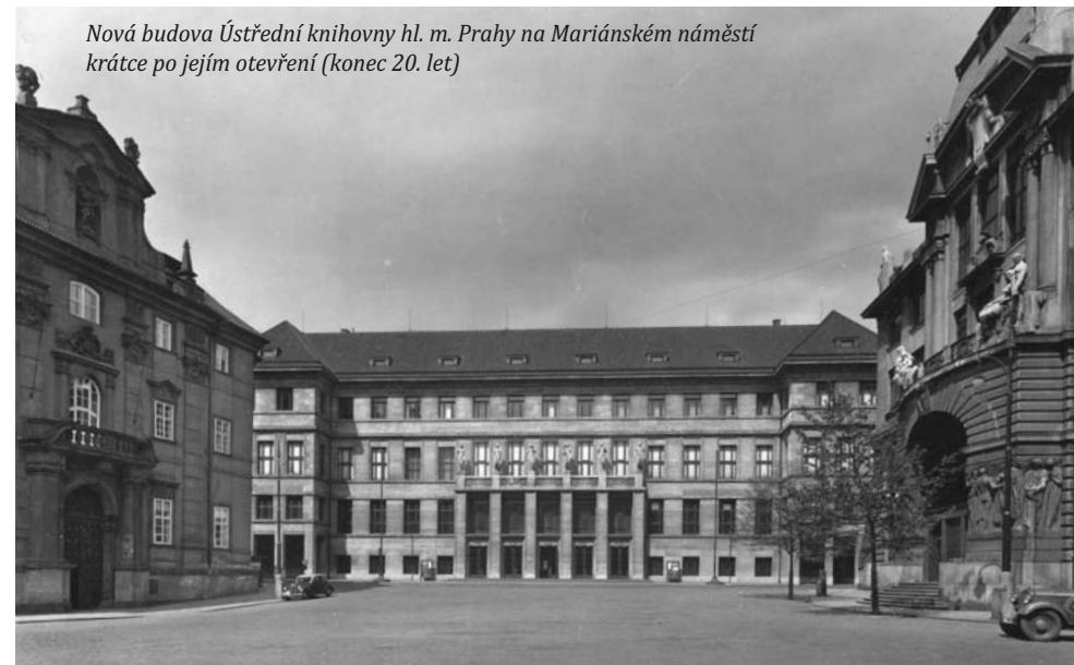
Nová budova Ústřední knihovny hl. m. Prahy na Mariánském náměstí krátce po jejím otevření (konec 20. let)

obecních knihoven 3 , některé dokonce starší než knihovna pražská: