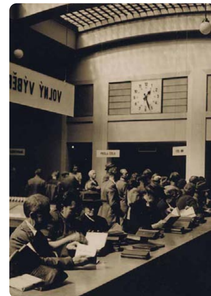
↓ Rušný provoz u výpůjčního protokolu Ústřední knihovny hl. m. Prahy (30. léta)